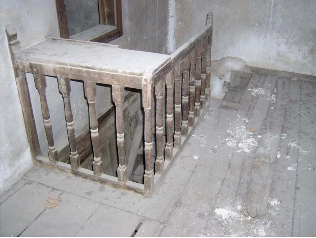
Şekil C.67. 101 Mekânı'nda yer alan ahşap korkuluk