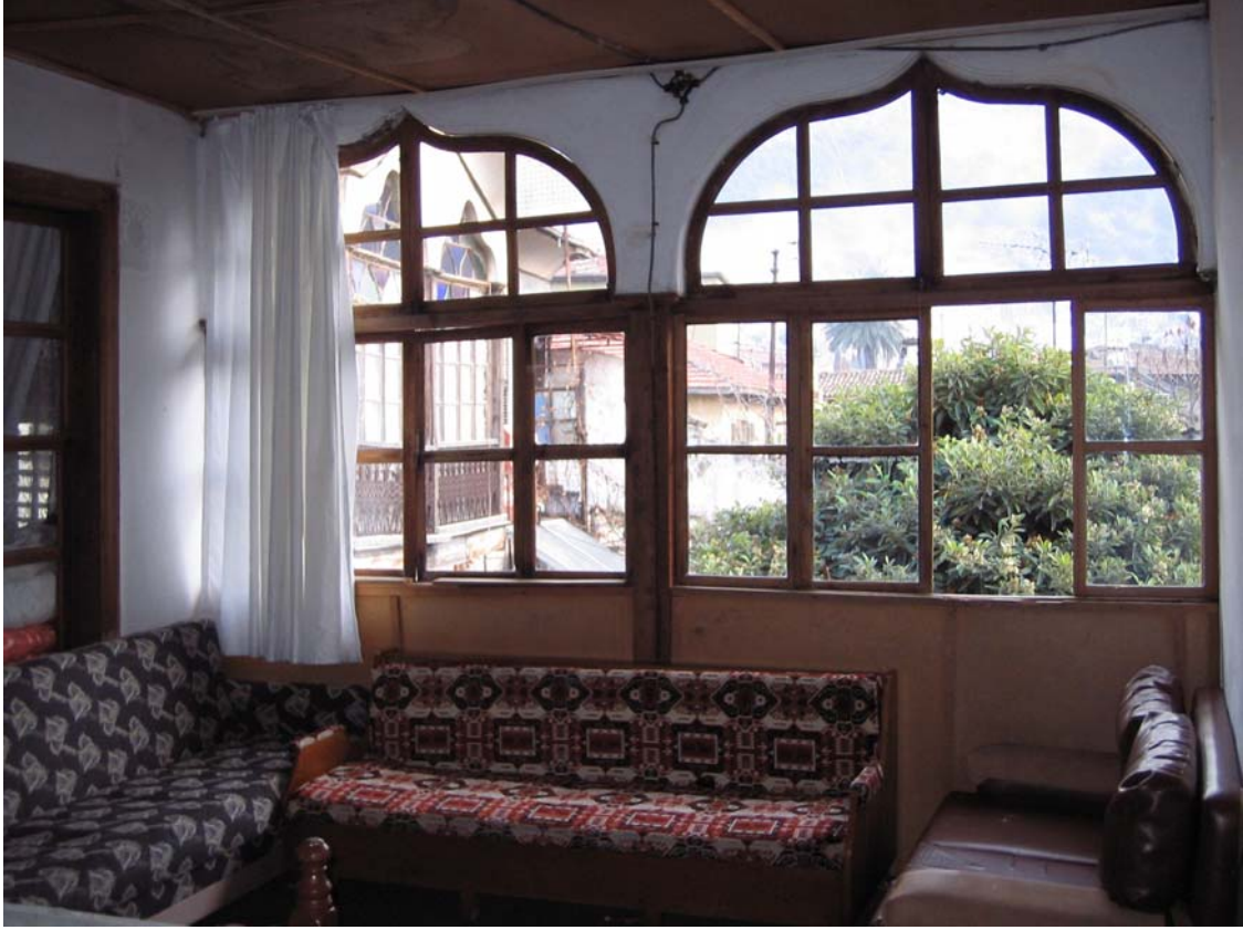
Şekil C.85. 108 Mekânı güneydoğu yönünden görünüşü