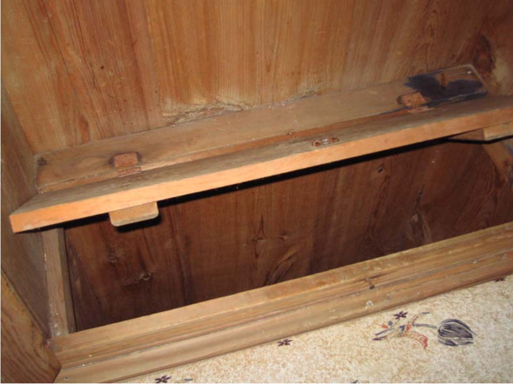
Şekil C.37. Z08 Mekânı'ndaki dolapların alt kısmı