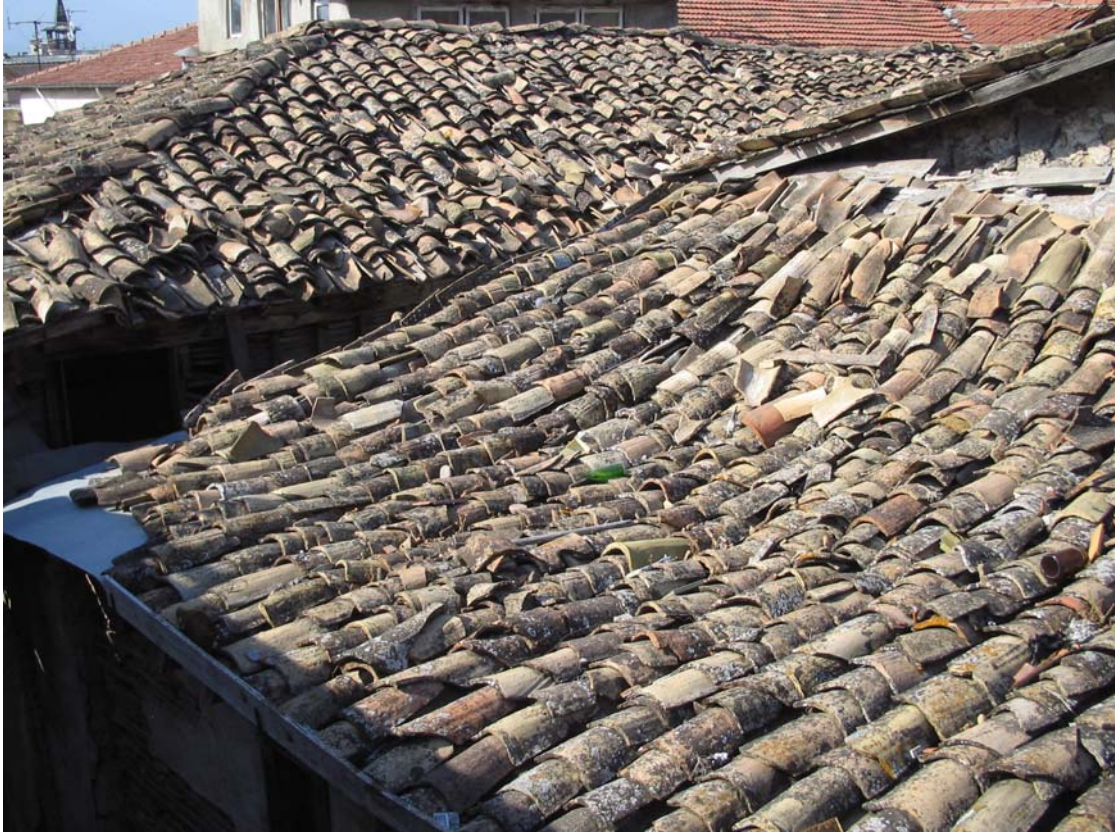
Şekil C.186. 104 Mekânı çatısının güney yönünden görünüşü