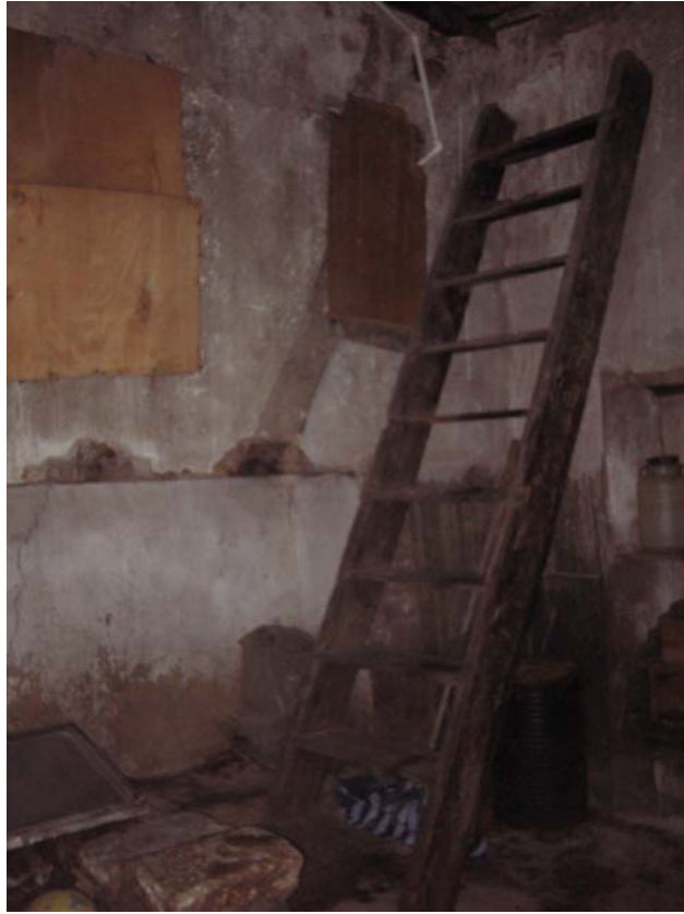
Şekil C.152. Z06-Kiler mekânındaki ahşap merdiven ve duvardaki izi