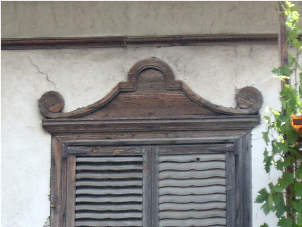
Şekil C.96. 112 Mekâni'nda koridor kısmında yer alan, avluya açılan pencerelerin avlu cephesinde görülen ahşap söve