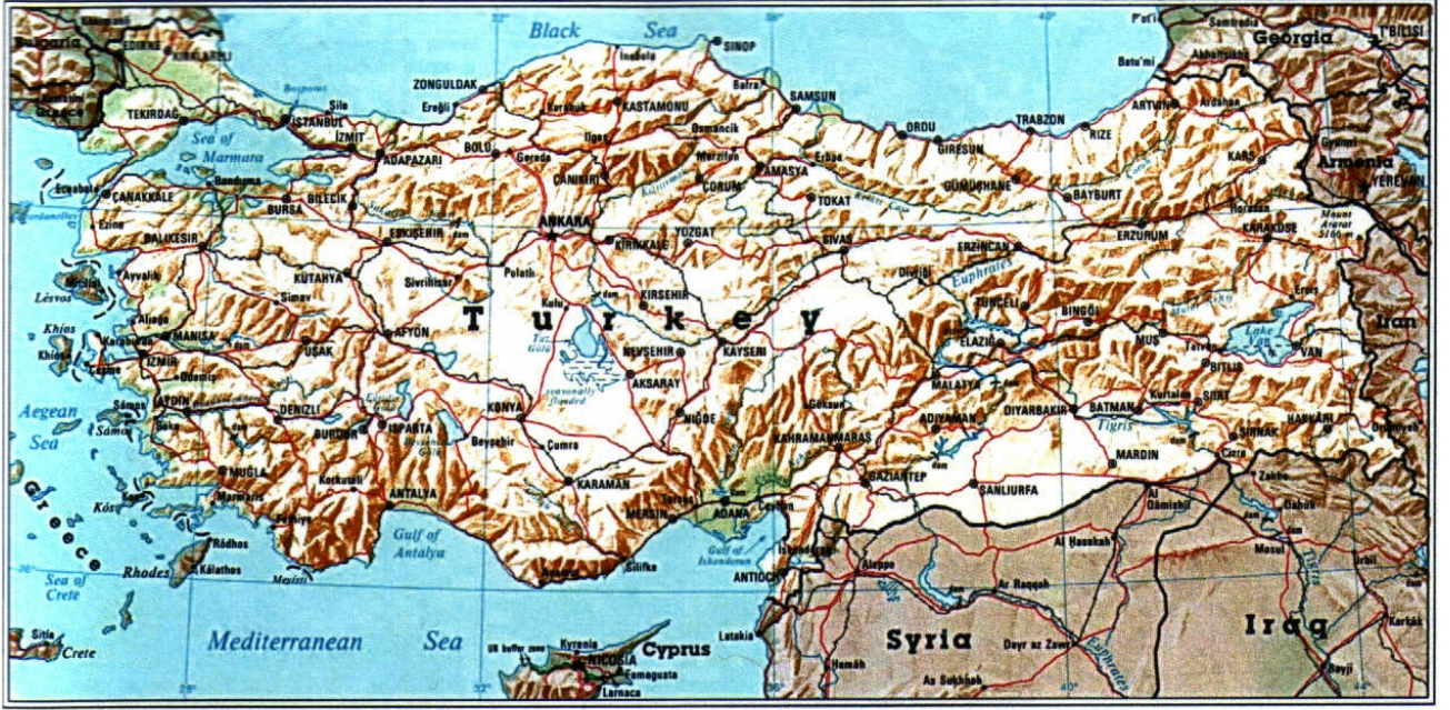
Şekil A.1. Türkiye