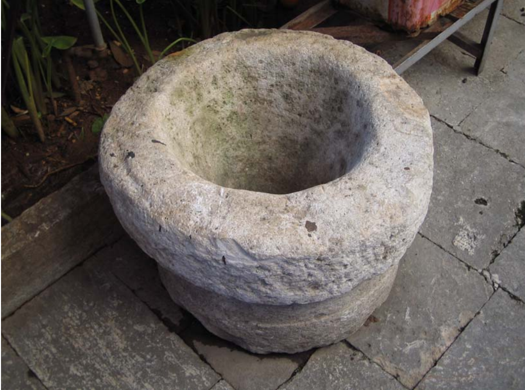
Şekil C.117. Avluda yer alan soku elemanının güneydoğu yönünden görünüşü