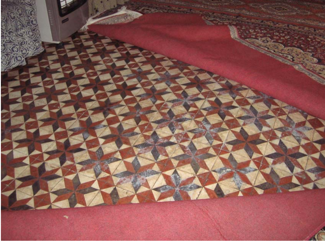
Şekil C.43. Z09 Mekânı döşeme yükselmesi