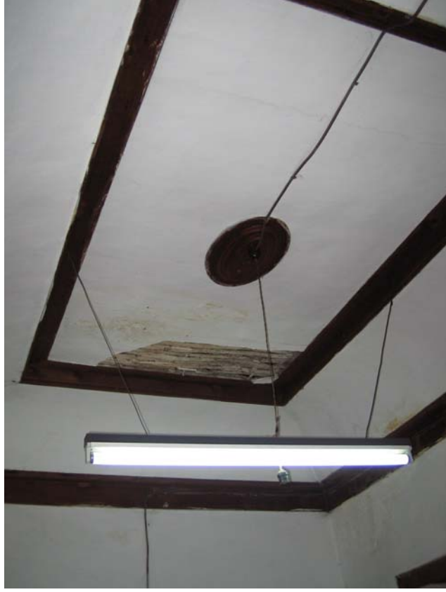
Şekil C.81. 106 Mekânı tavanı