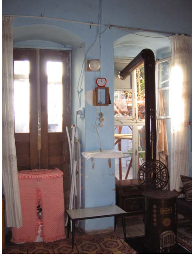
Şekil C.53. Z11 Mekânı güneybatı duvarı