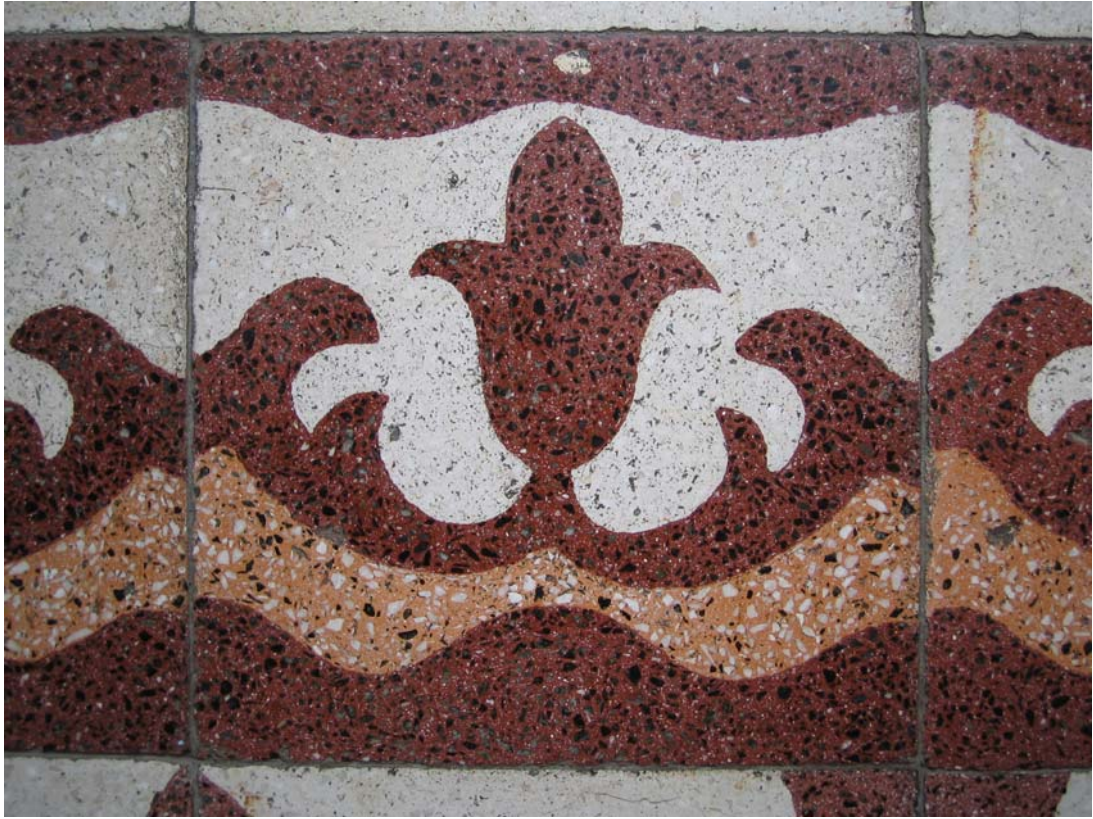
Şekil C.50. Z11 Mekâni terrazzo kenar sutaşı deseni