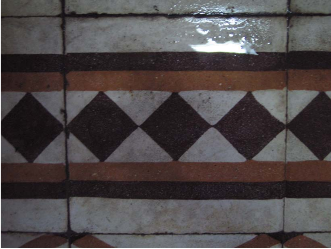
Şekil C.61. Z14 Mekânı terrazzo kenar sutaşı deseni