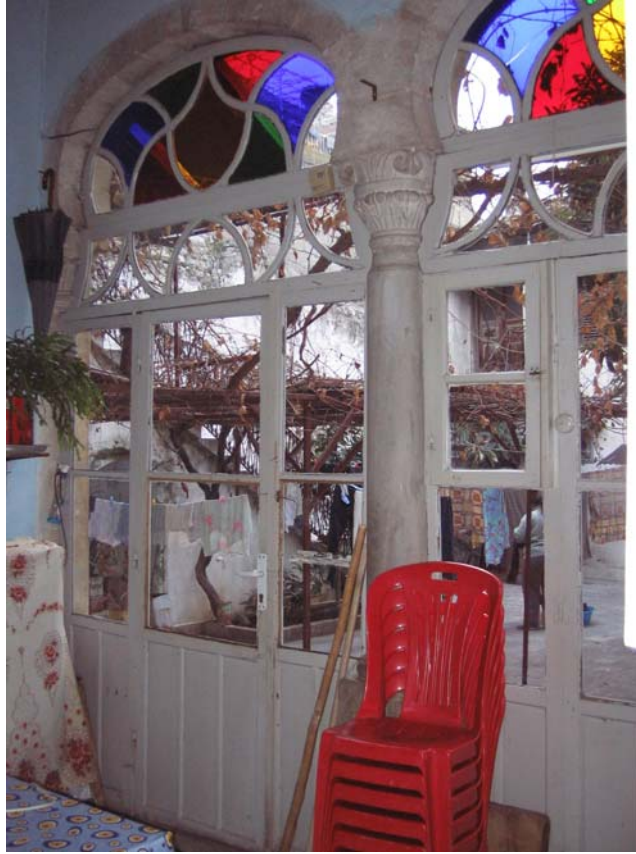
Şekil C.46. Z10 Mekânı güneybatı duvarı