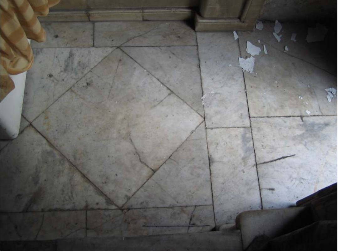
Şekil C.23. Z07 Mekânı eşiklik deseni