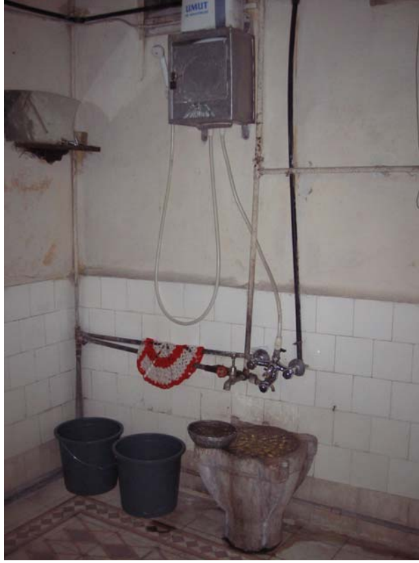
Şekil C.59. Z14 Mekâni güney yönünden görünüşü