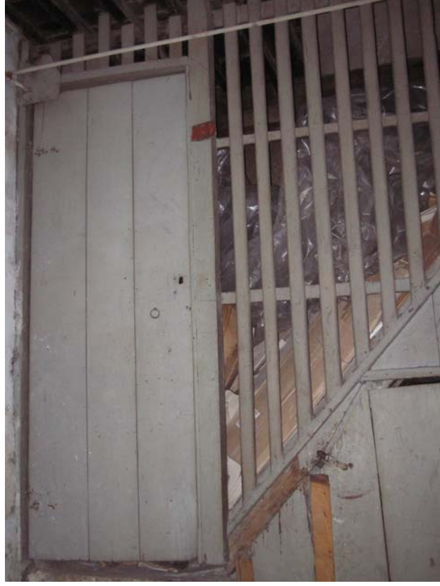
Şekil C.116. Yapının giriş kapısının kuzeybatısında konumlanan selamlık merdiveni