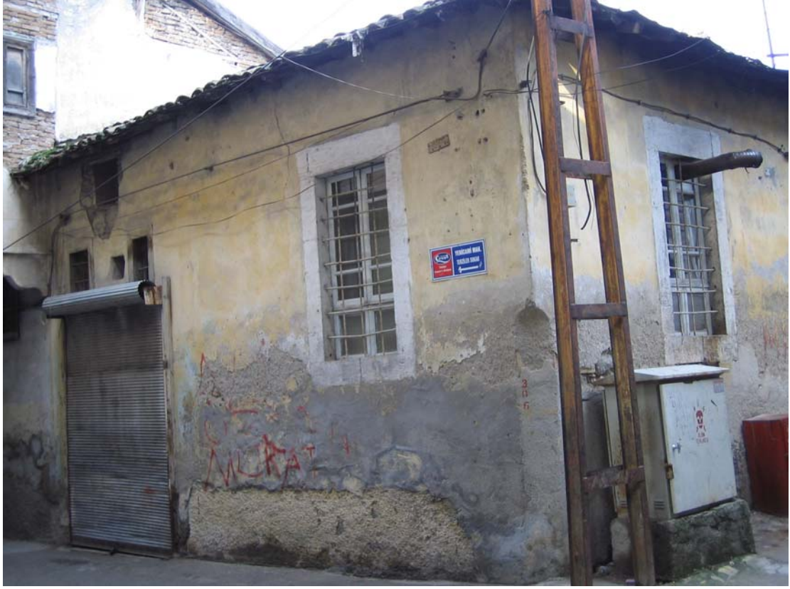
Şekil C.169. Güneydoğu yönündeki komşu yapının Yeni Cami Sokak'tan görünüşü