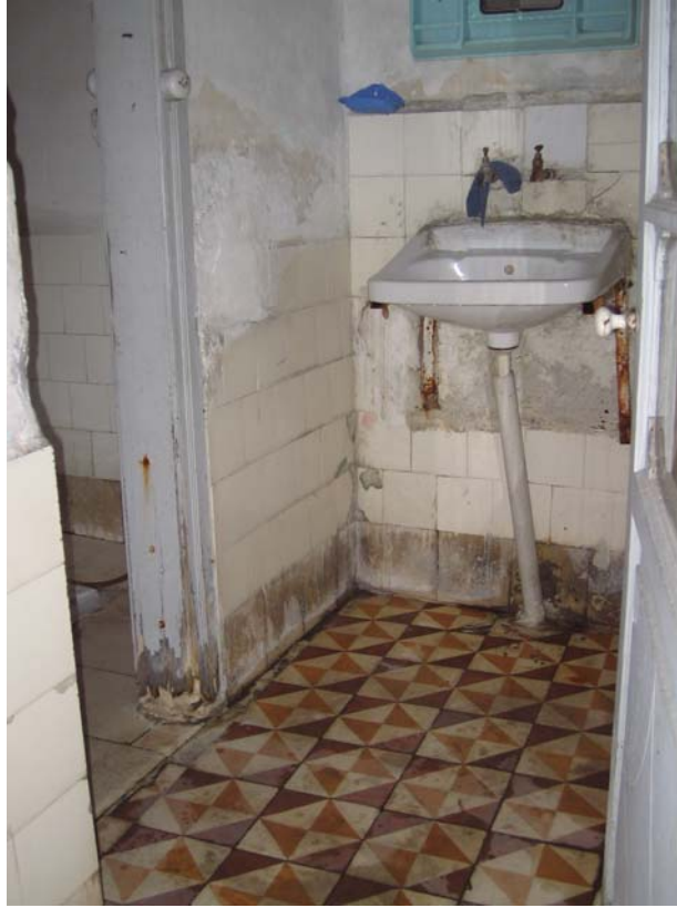
Şekil C.64. Z17 Mekâmı terrazzo deseni