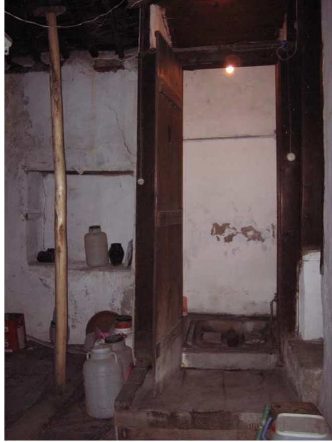
Şekil C.77. 105 kod numaralı helâ