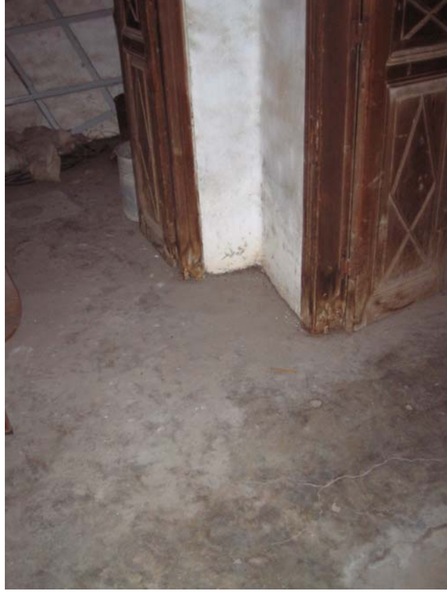
Şekil C.132. 116-Hol mekânı döşemesi