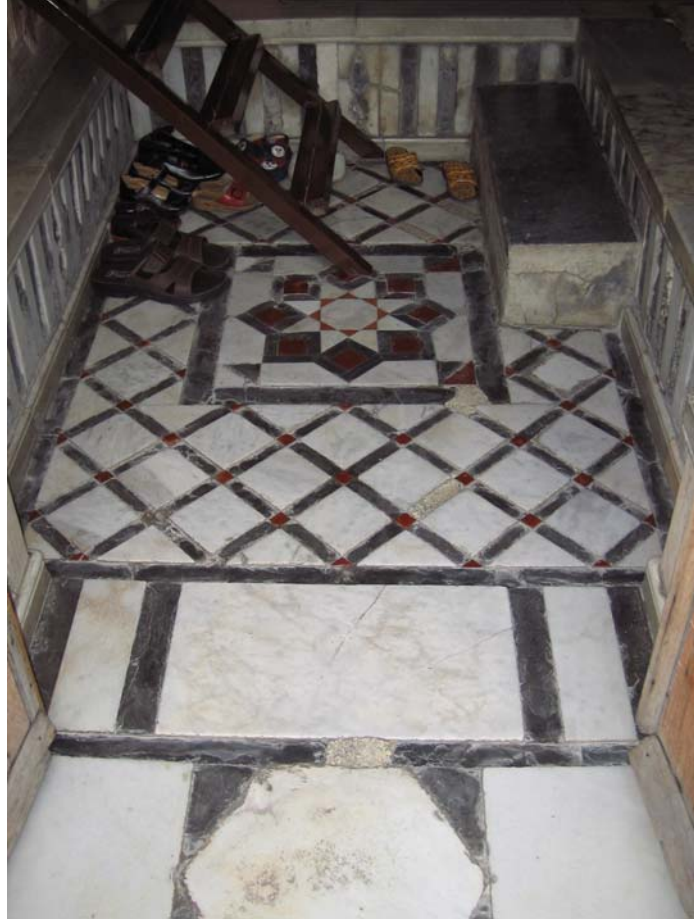
Şekil C.130. Z08-Oturma odası eşikliğine eklenen metal merdiven