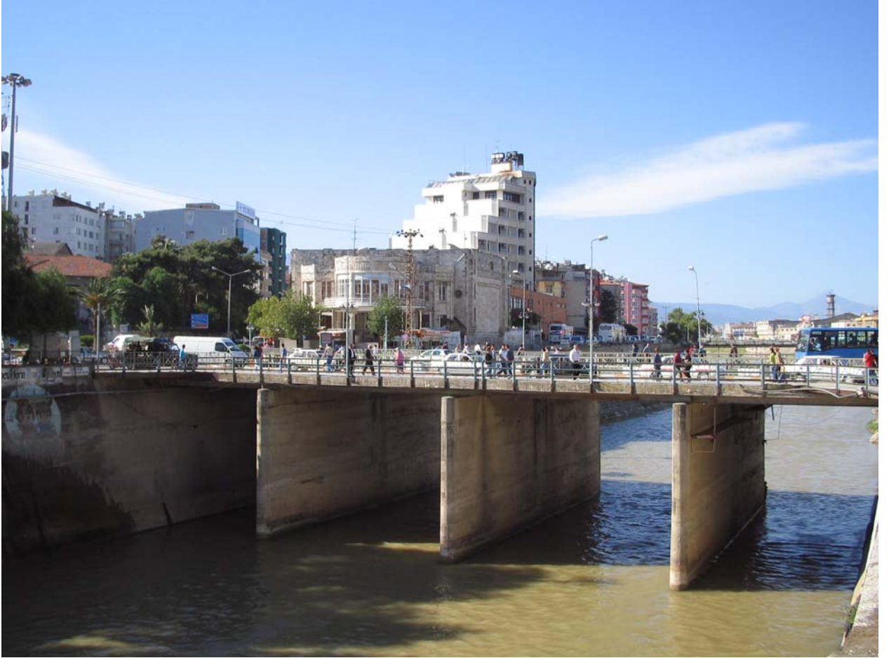
Şekil A.4. Günümüzde Asi’nin üstünde yer alan köprü