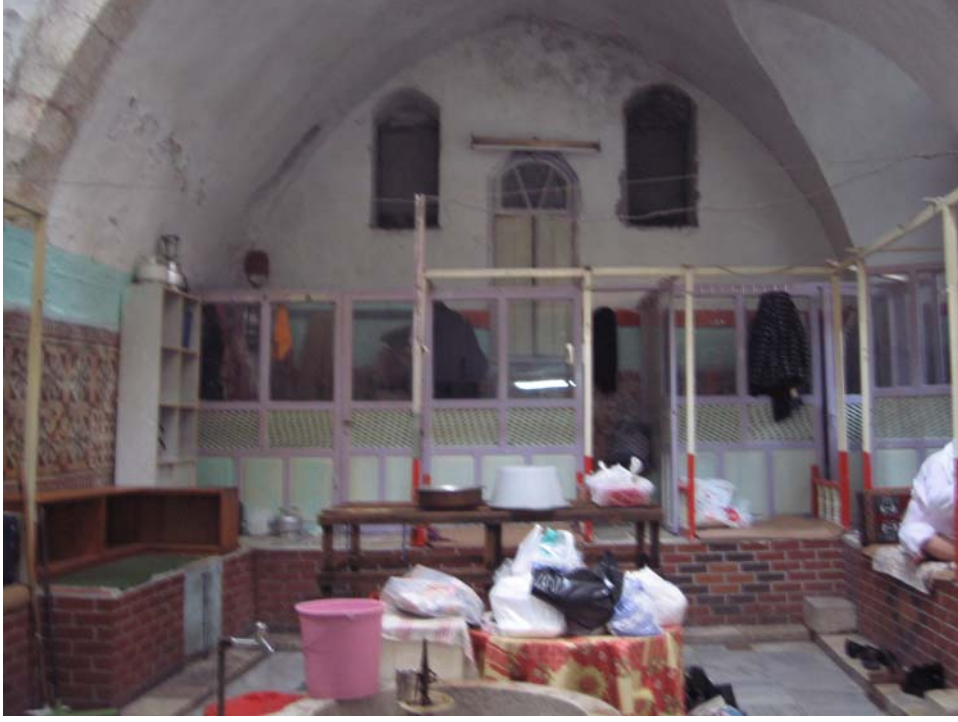
Şekil A.5. Cindi Hamamı soyunmalık kısmı