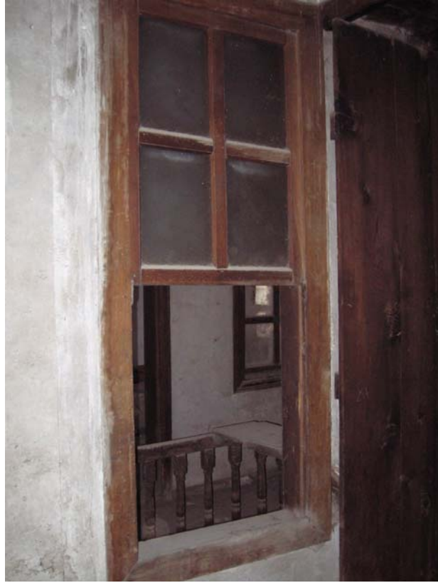
Şekil C.70. 102 Mekânı'nda yer alan pencere