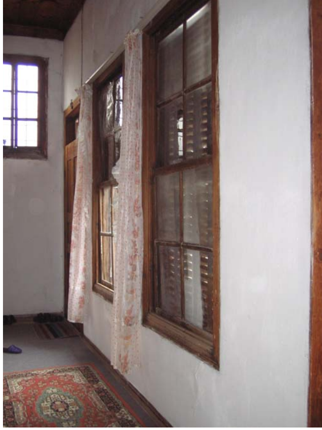
Şekil C.95. 112 Mekâni'nda koridor kısmında yer alan, avluya açılan pencerelerin kuzey yönünden görünüşü