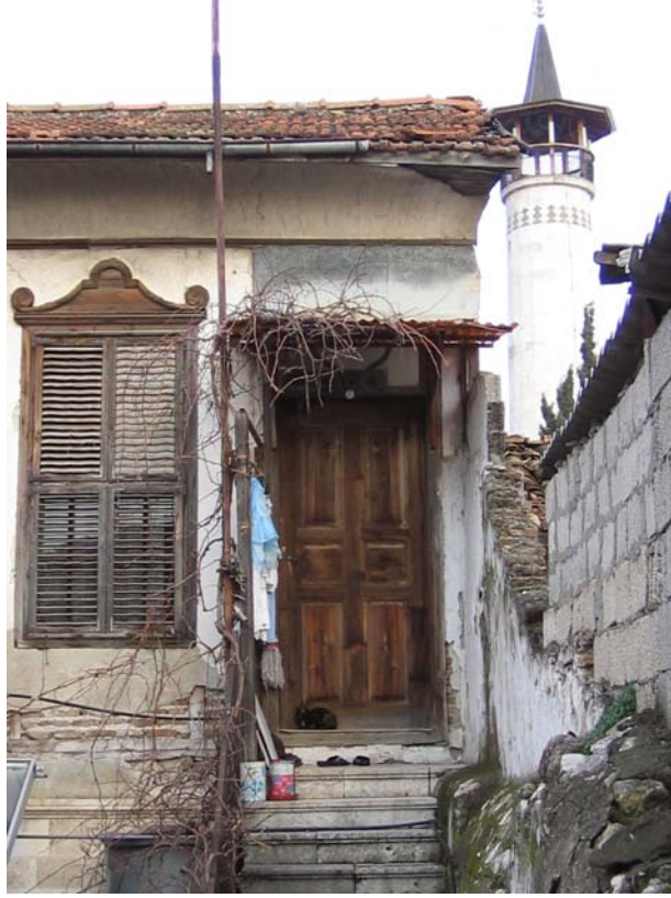
Şekil C.139. Avlu kuzeydoğu cephesi K120 kapısı görünüşü