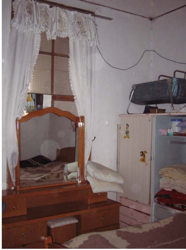
Şekil C.93. 111 Mekânı'nın sofaya açılan penceresinin doğu köşesinden görünüşü