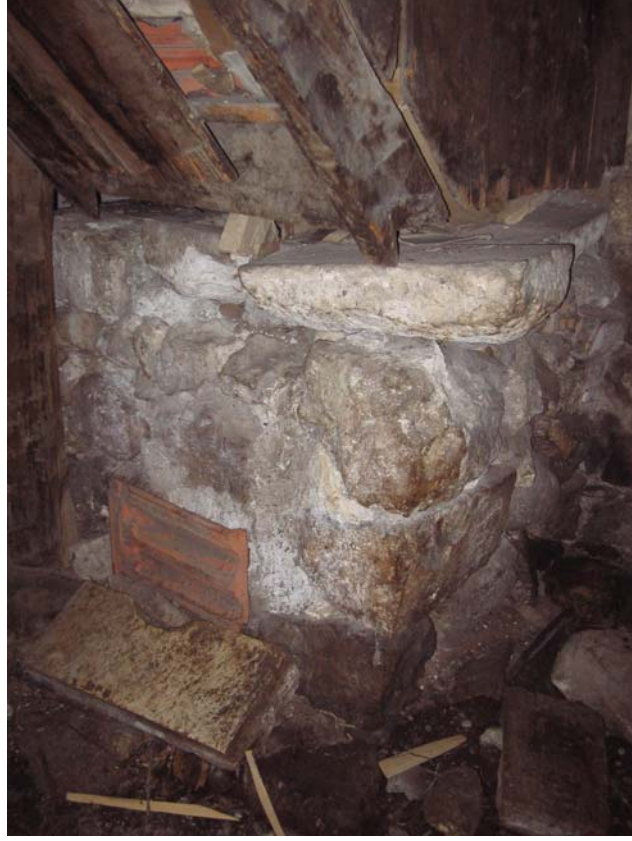
Şekil C.11. Z03 Mekânı'nda görülen taş sahanlık