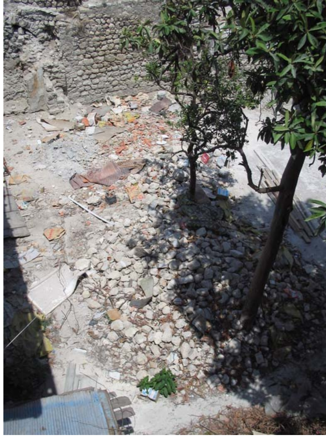
Şekil C.144. Doğu yönündeki avluda yer alan çeşmenin izi ve molozlar