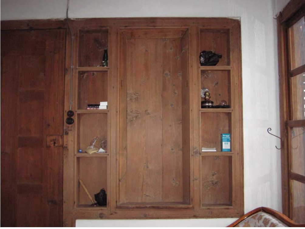
Şekil C.83. 107 Mekânı kuzeydoğu duvarında yer alan niş ve raflar