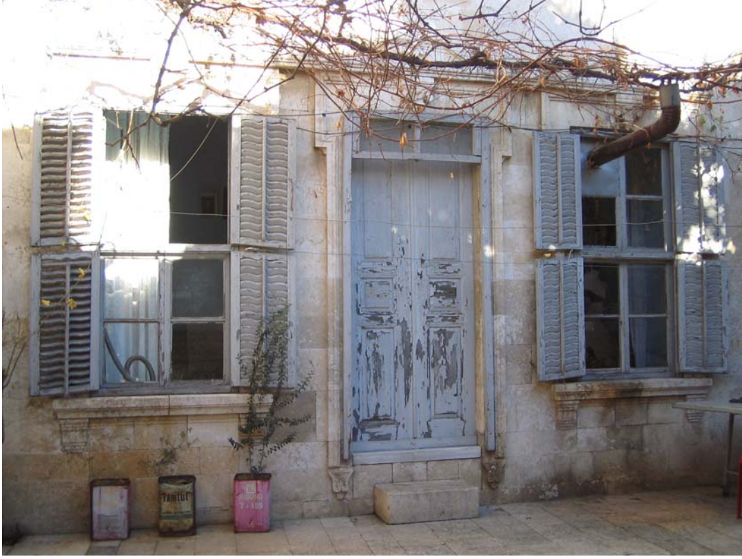
Şekil C.153. Avlu kuzeydoğu cephesindeki KZ11 kapısı