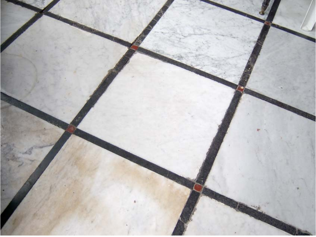
Şekil C.47. Z10 Mekânı zemini