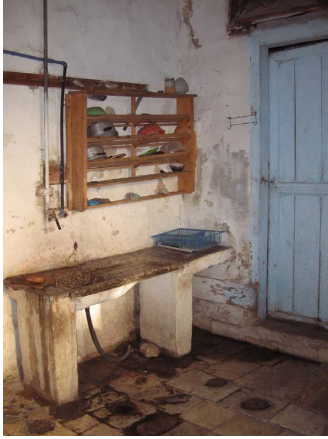
Şekil C.15. Z04 Mekânı'nda yer alan eviye