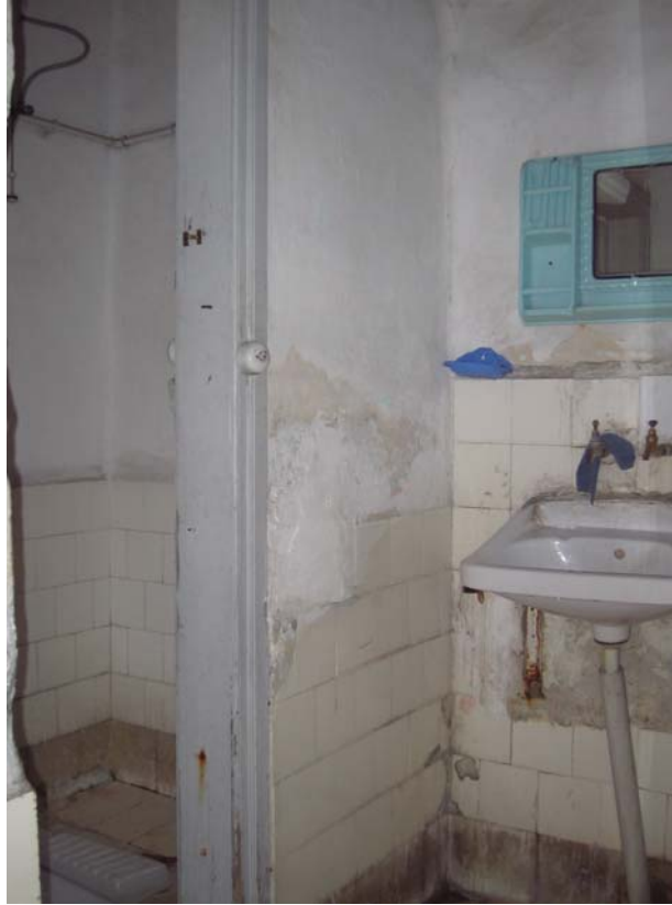
Şekil C.62. Z16 Mekânı güney yönünden görünüşü