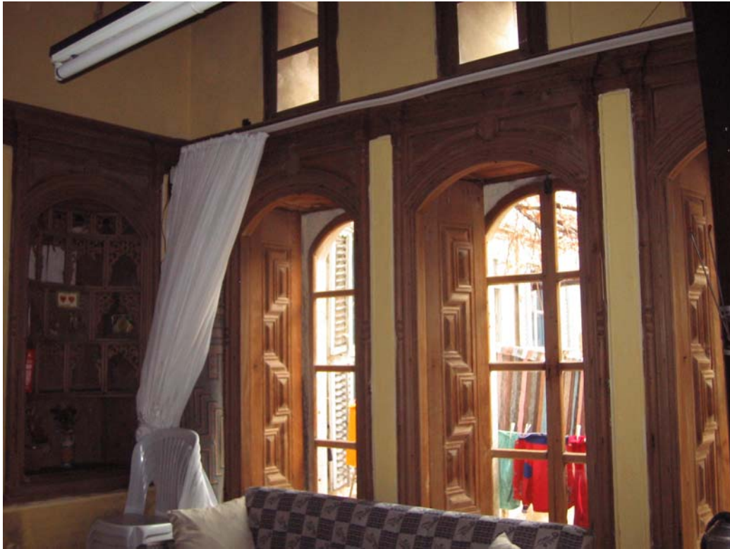
Şekil C.36. Z08 Mekânı kuzeydoğu duvarındaki kitabiye