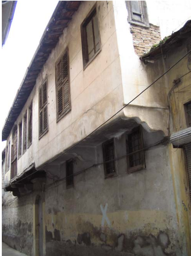
Şekil C.184. Terziler Sokak cephesi kuzey yönünden görünüşü