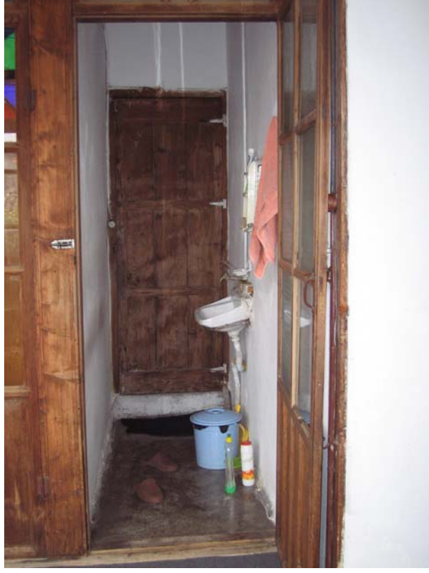
Şekil C.99. 113 Mekânı kuzeydoğu yönünden görünüşü