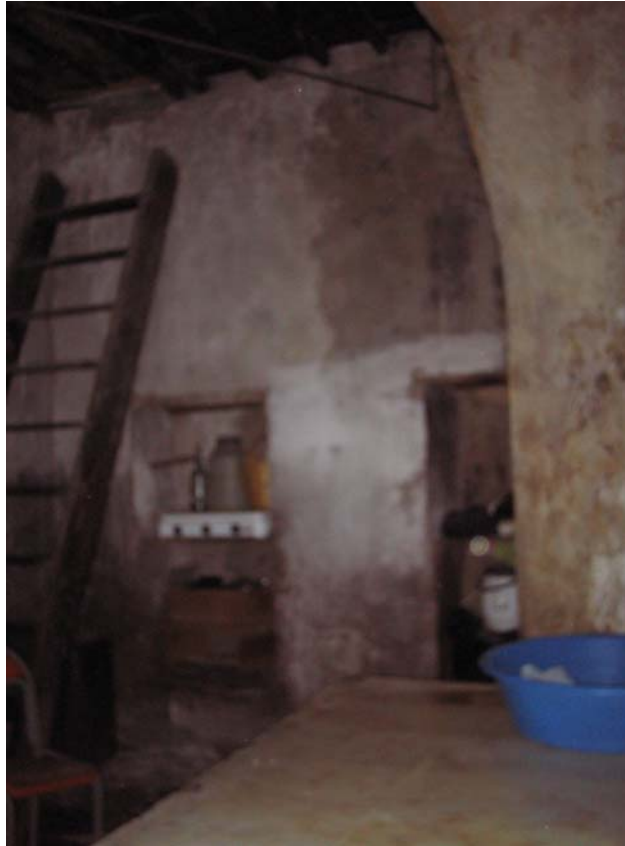
Şekil C.18. Z06 Mekânı güneydoğu yönünden görünüşü