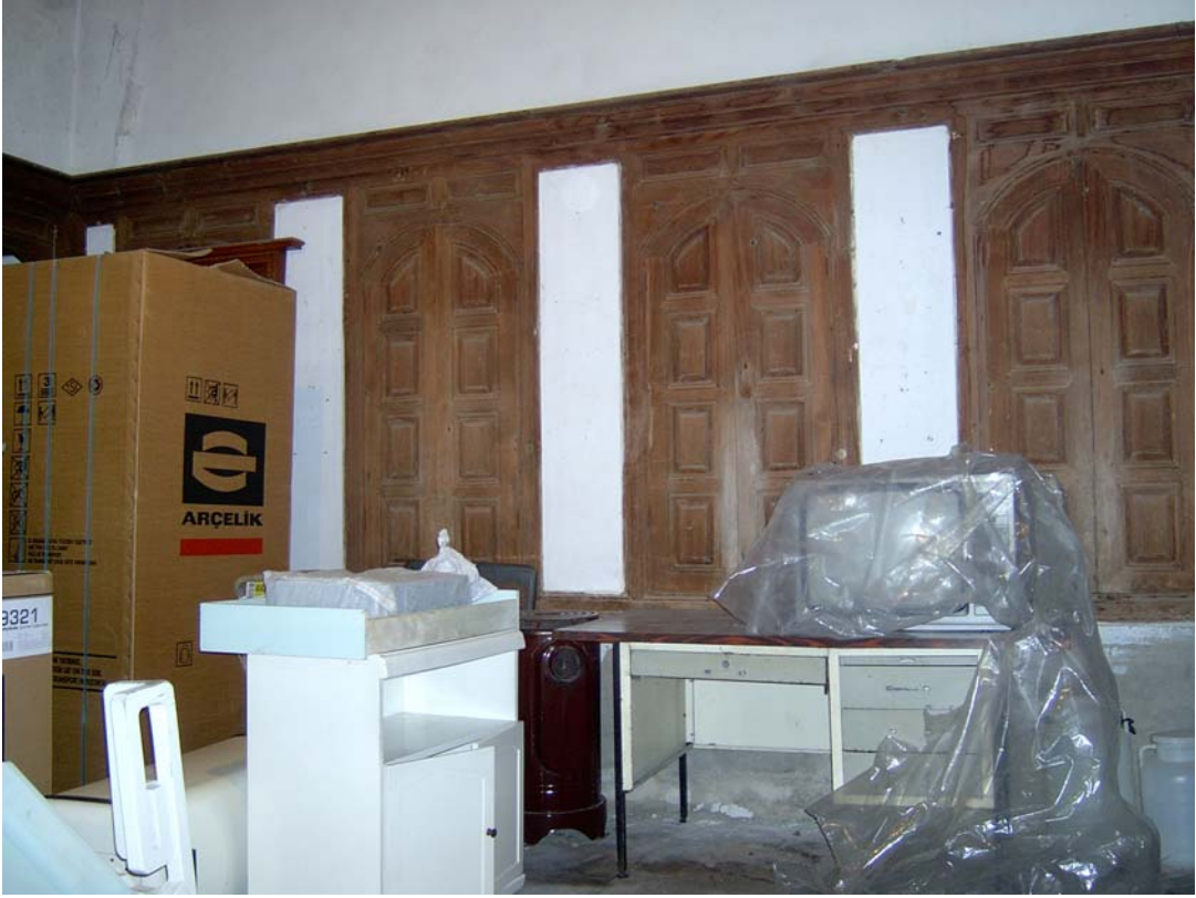
Şekil C.25. Z07 Mekânı kuzeybatı duvarındaki dolaplar