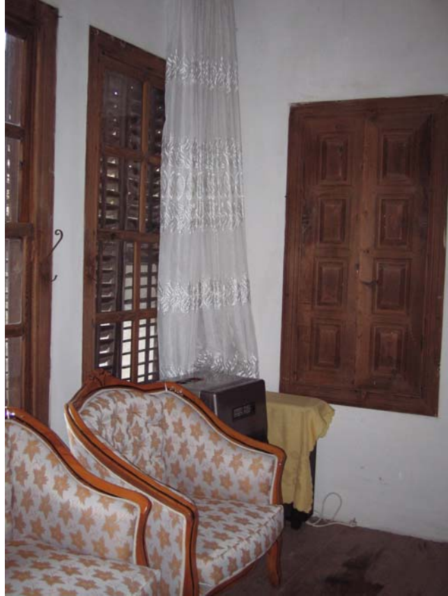
Şekil C.82. 107 Mekânı