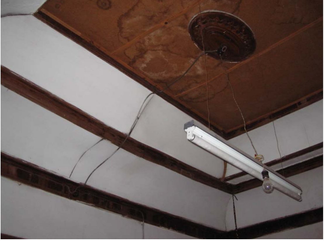
Şekil C.135. 109-Yatak odası tavanı