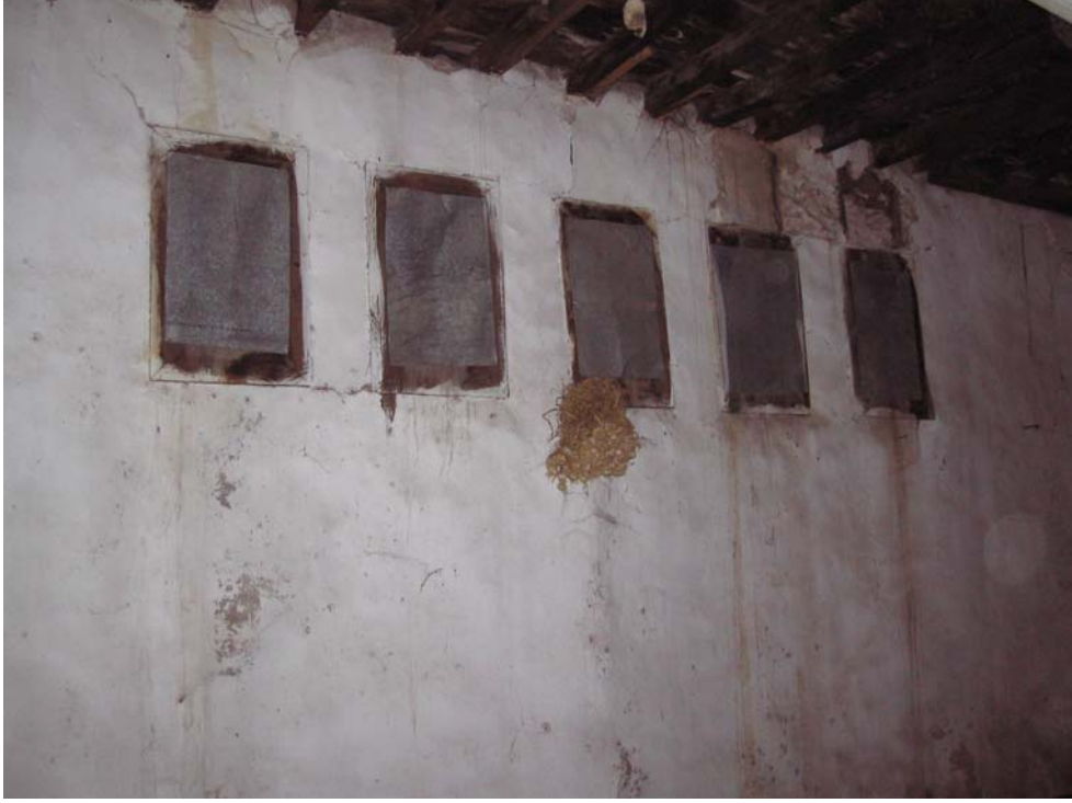
Şekil C.75. 104 Mekânı güneybatı duvarındaki pencereler