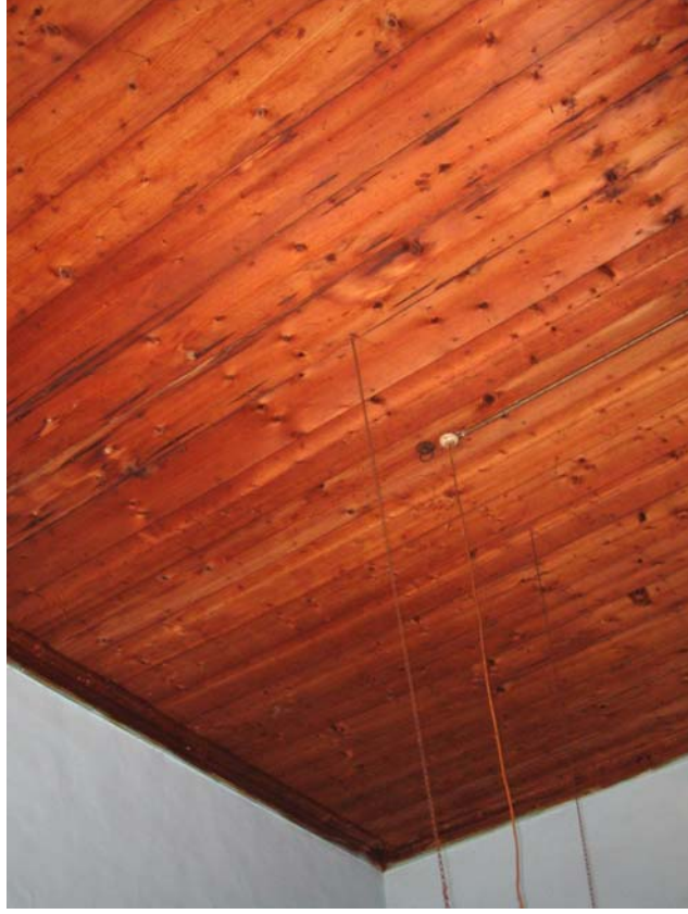
Şekil C.45. Z10 Mekânı tavanı