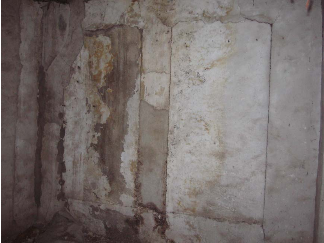
Şekil C.182. 103 Mekânı kuzeydoğu duvarı