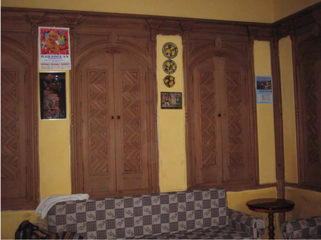
Şekil C.34. Z08 Mekânı kuzeybatı duvarındaki dolaplar