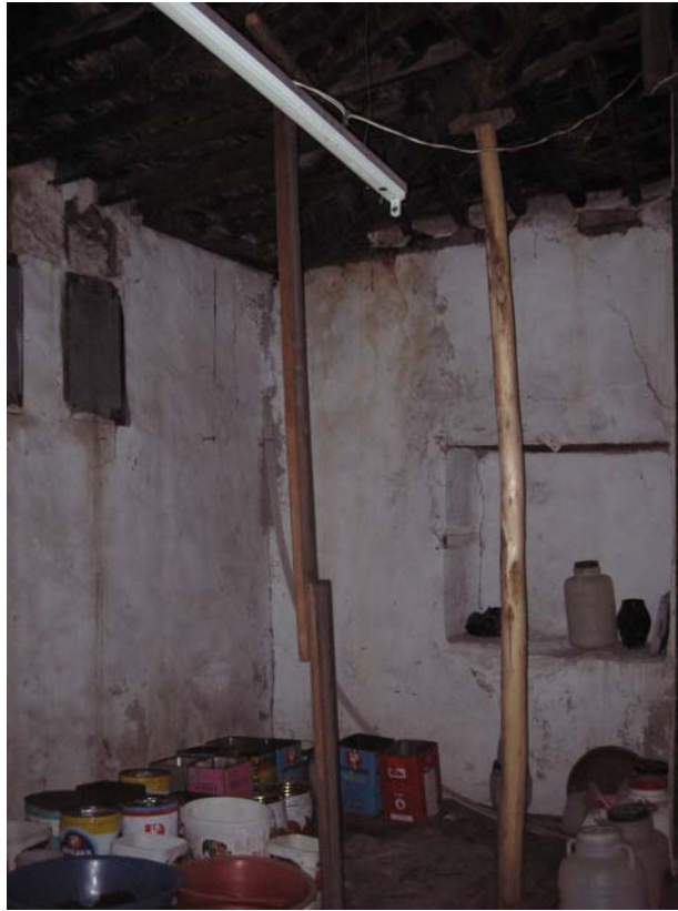
Şekil C.74. 104 Mekânı giriş kapısından görünüşü