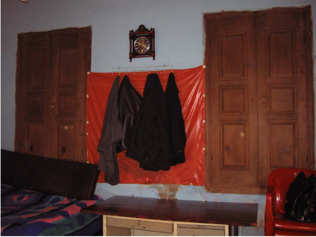
Şekil C.51. Z11 Mekânı güneydoğu duvarı