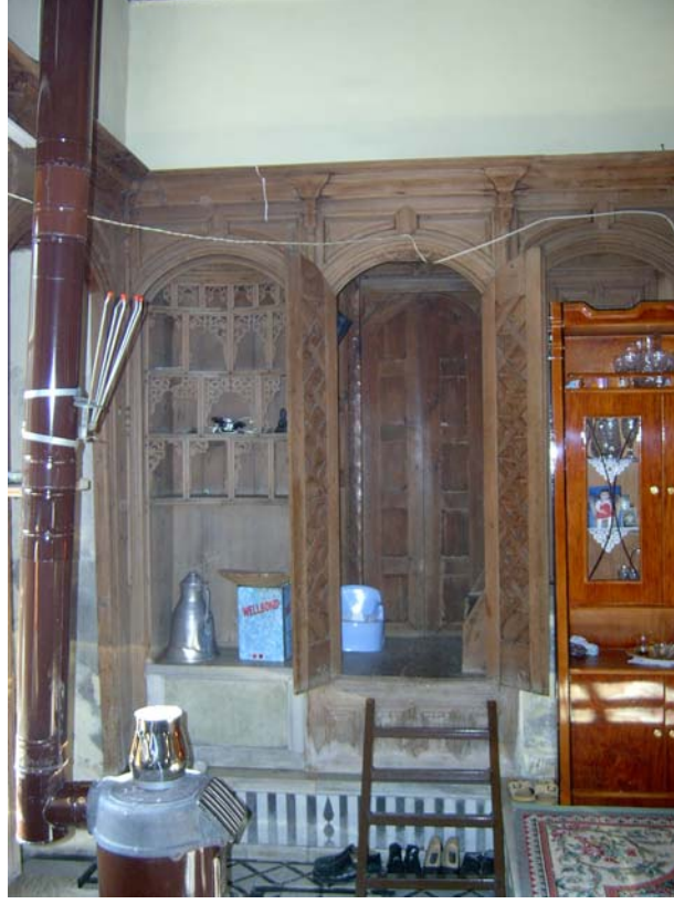
Şekil C.113. Z08 Mekânı'ndan açılan merdiven kapakları