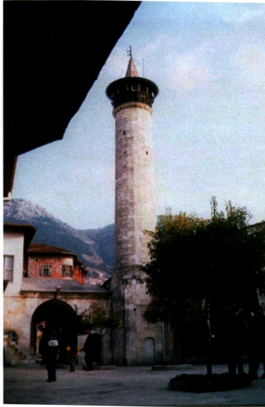
Şekil B.2. Habib'in Neccar Camii minaresi