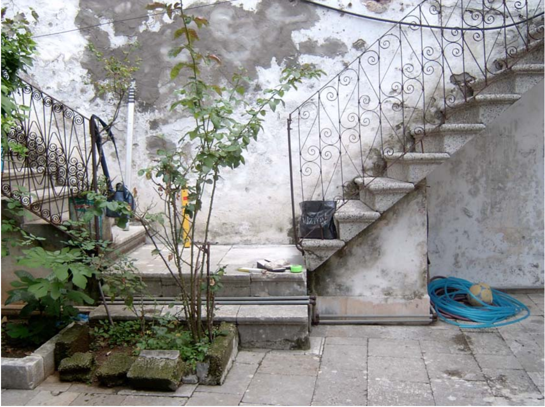
Şekil C.167. Avludaki sahanlık önüne yapılan çiçeklik eki