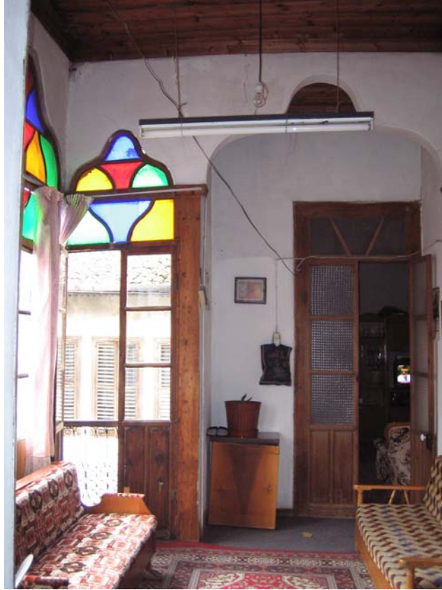
Şekil C.94. 112 Mekânı'nın güneydoğu köşesinden görünüşü