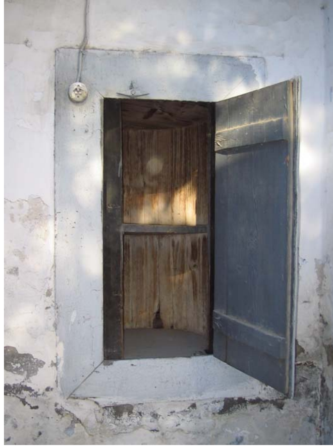
Şekil C.8. Döner dolabın avlu cephesinden görünüşü