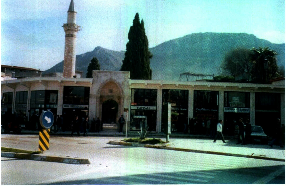
Şekil B.3. Ulu Cami giriş cephesi