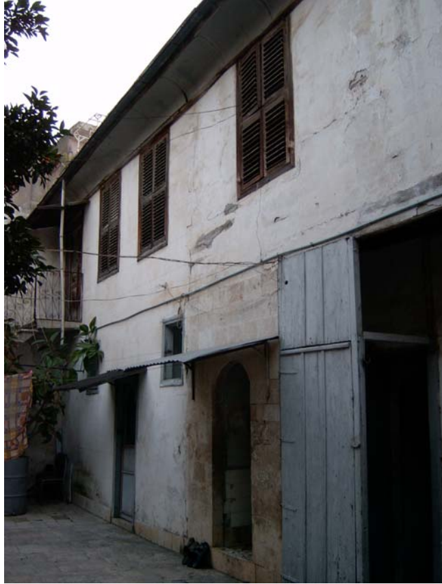
Şekil C.4. Yapının güneybatı yönünde konumlanan, 1924 yılında satın alınan kütlesinin batı yönünden görünüşü