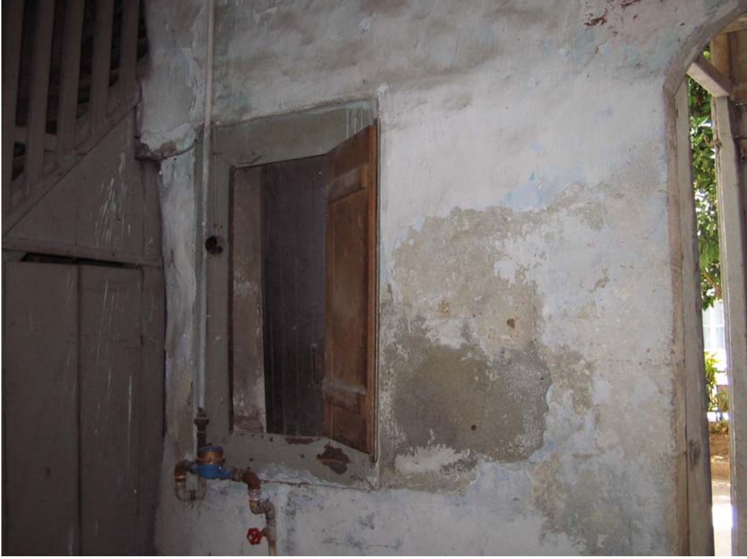
Şekil C.7. Döner dolabın giriş taşlığından görünüşü