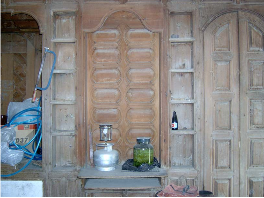
Şekil C.27. Z07 Mekânı kuzeydoğu duvarındaki nişler