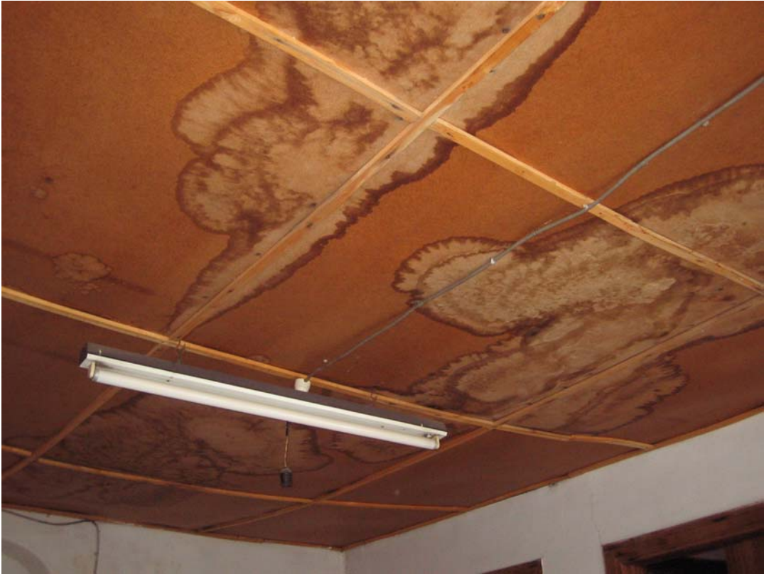
Şekil C.134. 108-Sofa mekânı tavan kaplaması