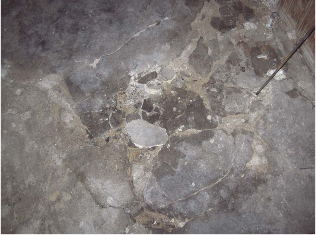
Şekil C.22. Z07 Mekânı döşemesinde görülen kırılmalar