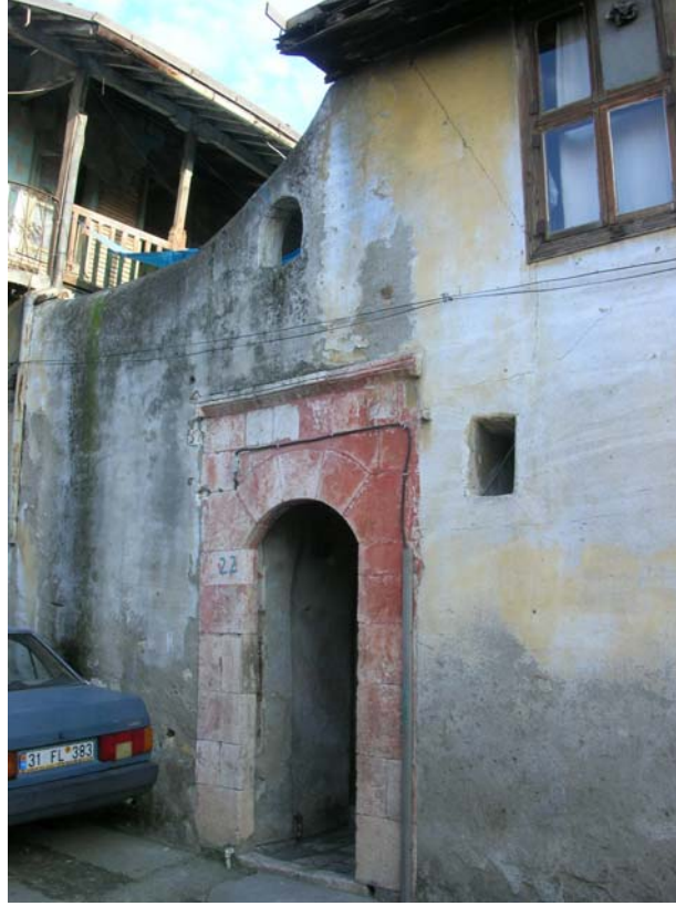
Şekil C.165. Akbaba Mahallesi, Çankaya Sokak, No:22'deki yapının avlu duvarının batı yönünden görünüşü