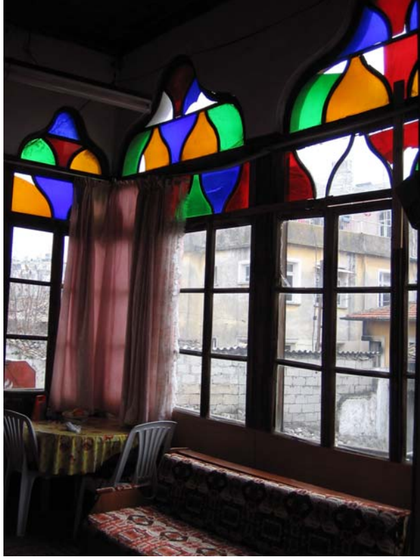
Şekil C.97. 112 Mekânı avlu çıkmasında yer alan renkli camların mekânın kuzey köşesinden görünüşü