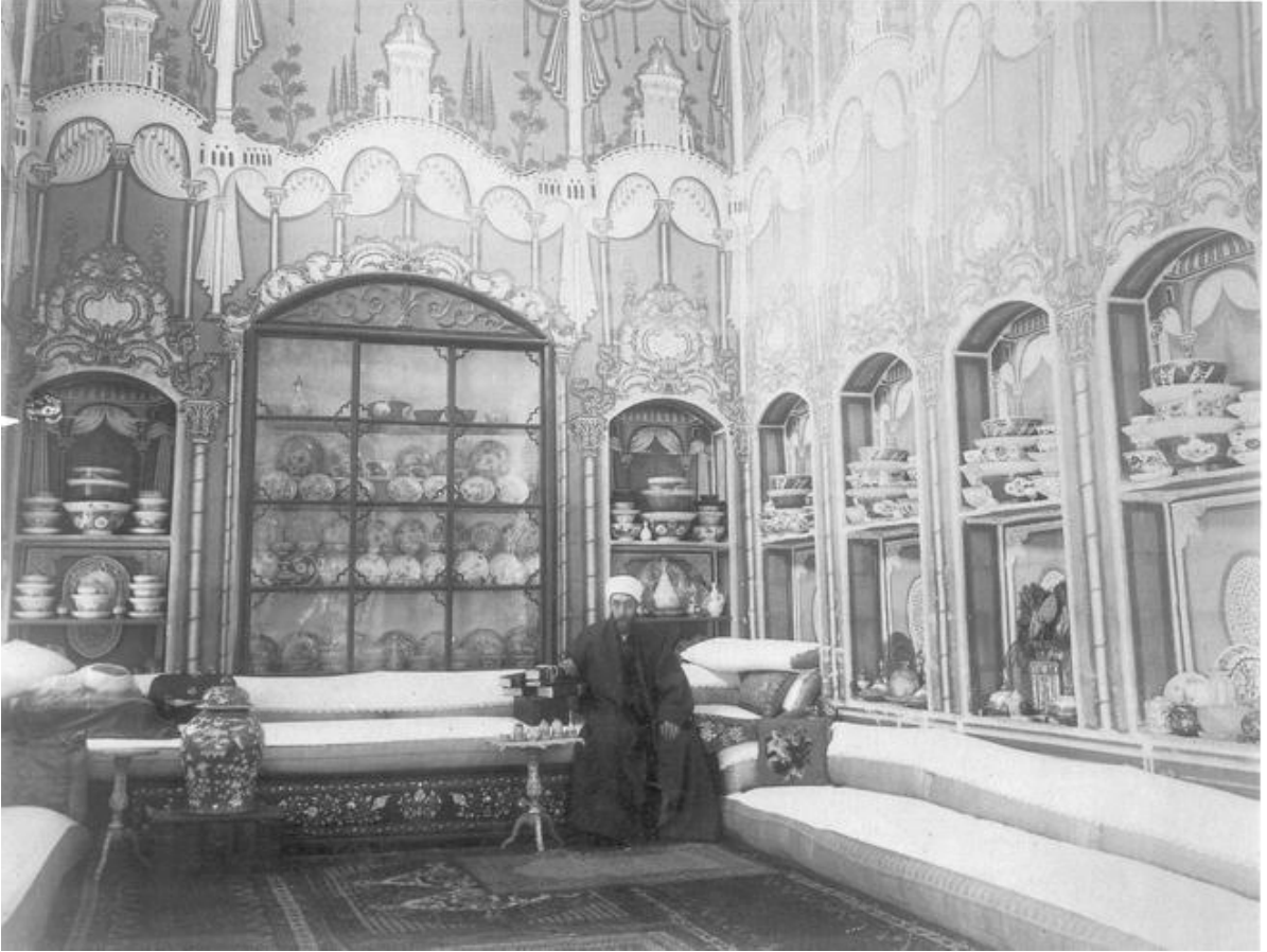
Şekil C.180. Eskiden kullanılan iç mekân tefrişleri (Weber, S., 2005)