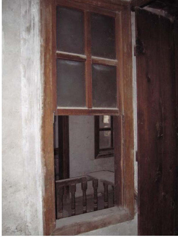
Şekil C.155. P104'ün 102 Mekânı'ndan görünüşü