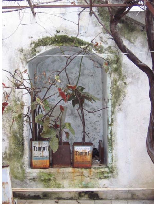
Şekil C.183. Avlu güneydoğu duvarında yer alan niş