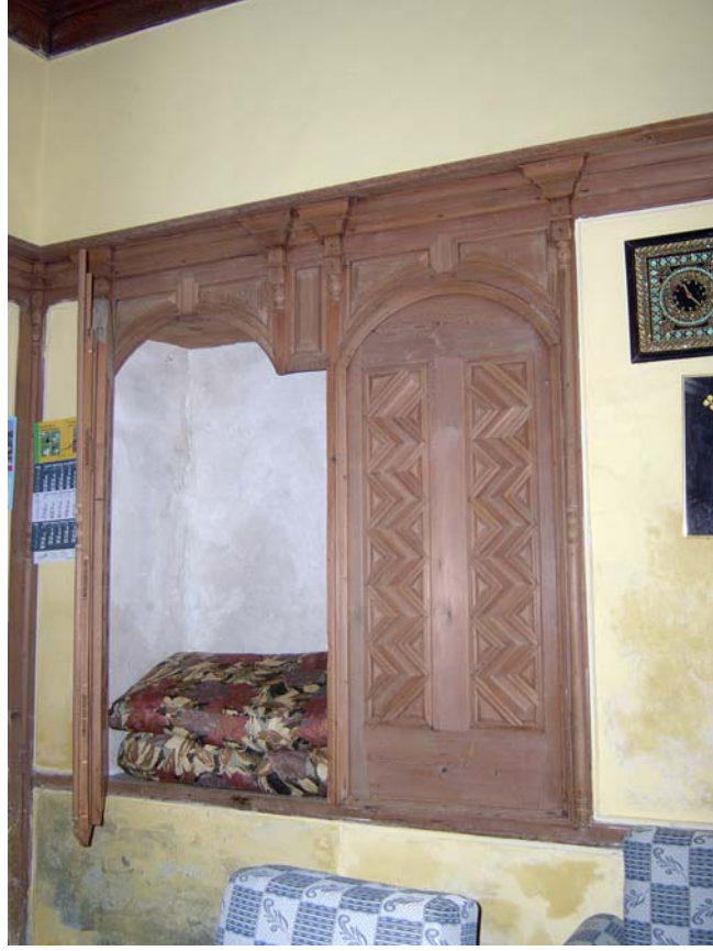
Şekil C.35. Z08 Mekânı kuzeydoğu duvarındaki dolap