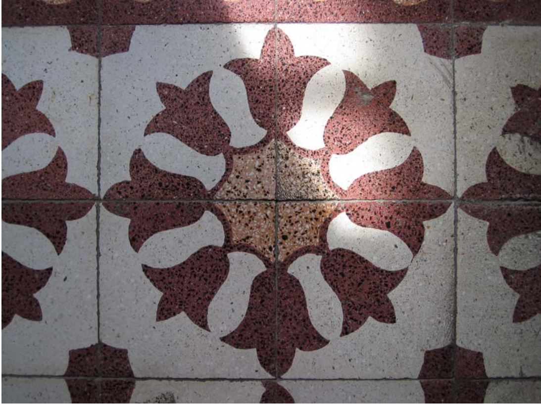
Şekil C.49. Z11 Mekâni terrazzo deseni