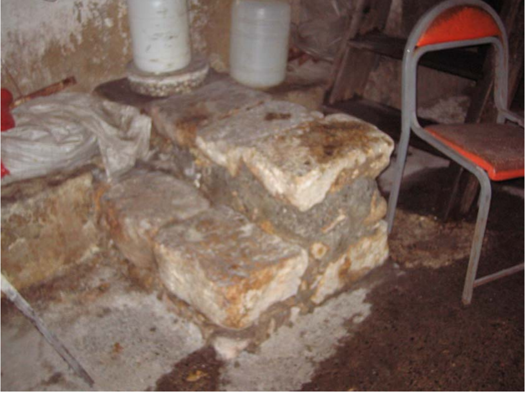
Şekil C.19. Z06 Mekânı'nda yer alan taş basamaklar