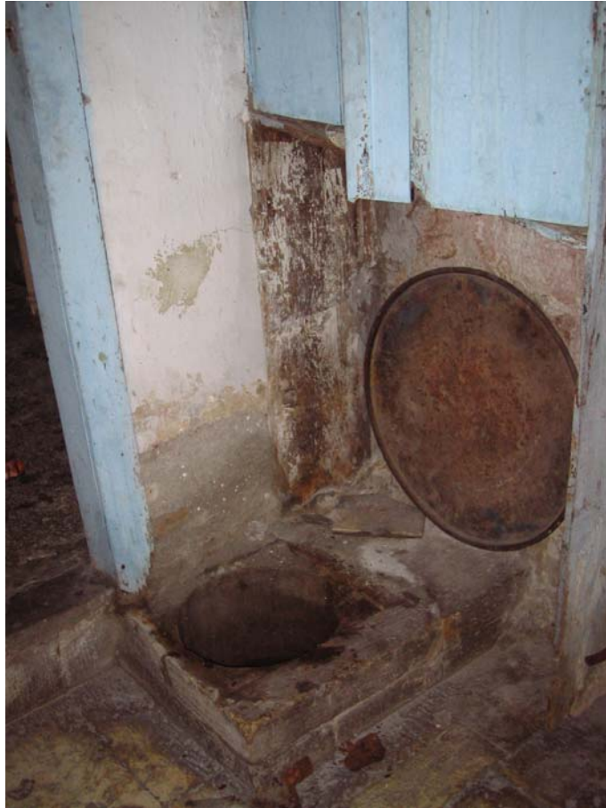
Şekil C.150. Z04-Mutfağın kuzey köşesindeki su haznesi