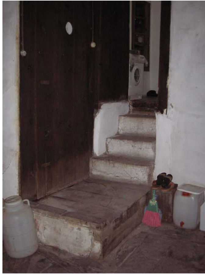
Şekil C.76. 104 ve 106 kod numaralı mekânlar arasındaki geçişi sağlayan basamaklar