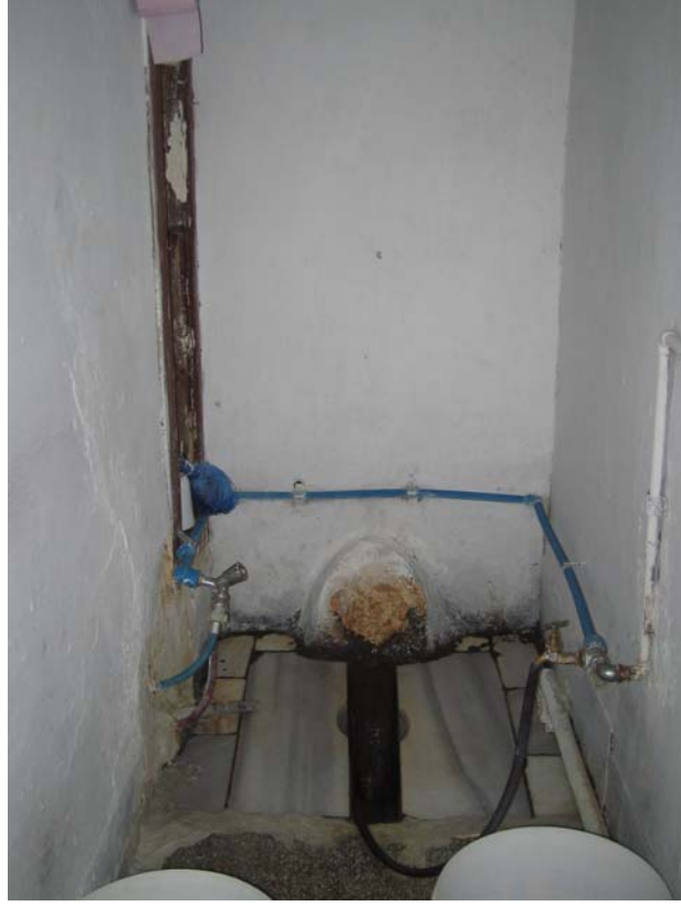
Şekil C.101. 114 Mekânı'nda yer alan helâ