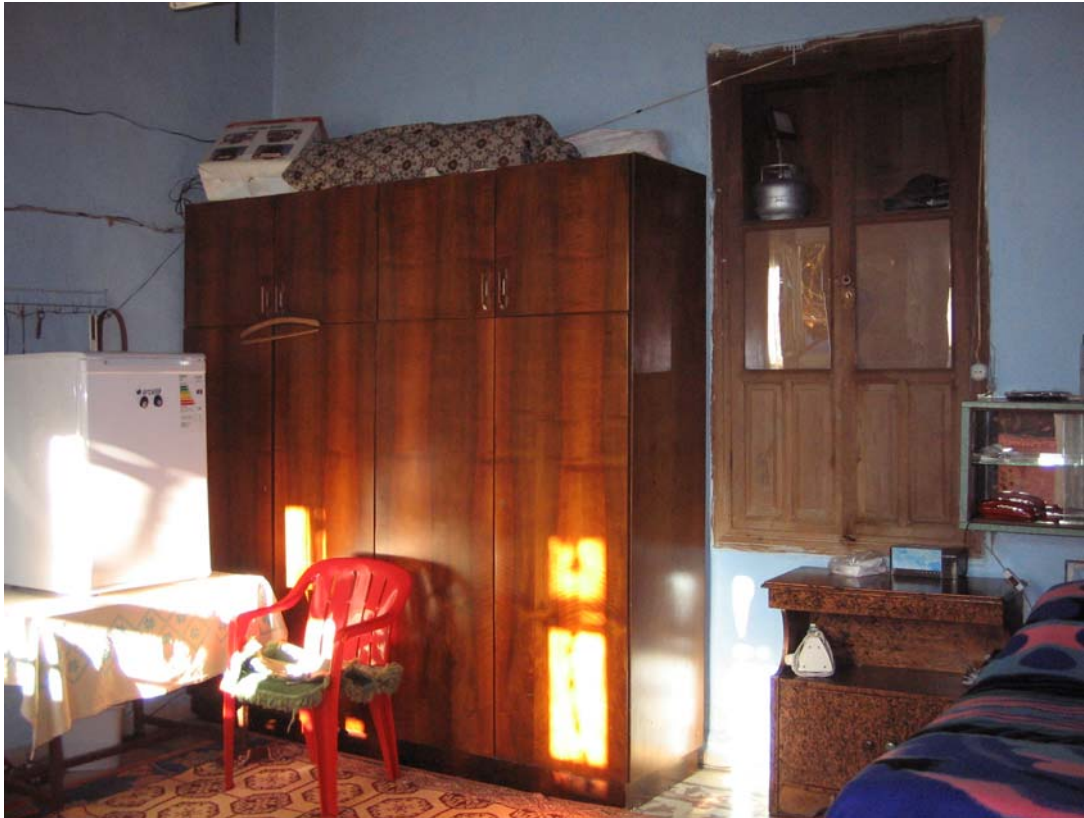
Şekil C.52. Z11 Mekânı kuzeydoğu duvarı