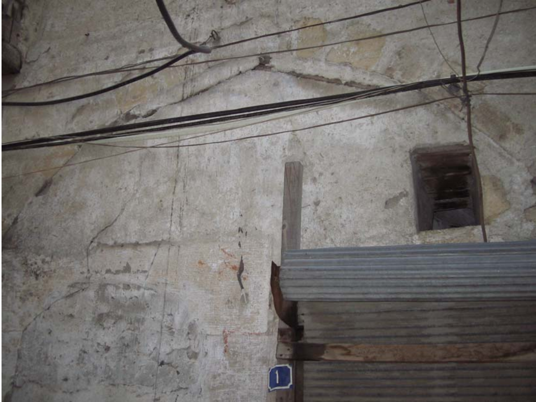
Şekil C.172. Kuzeybatı yönündeki komşu dükkânın kesme taş kemer izleri