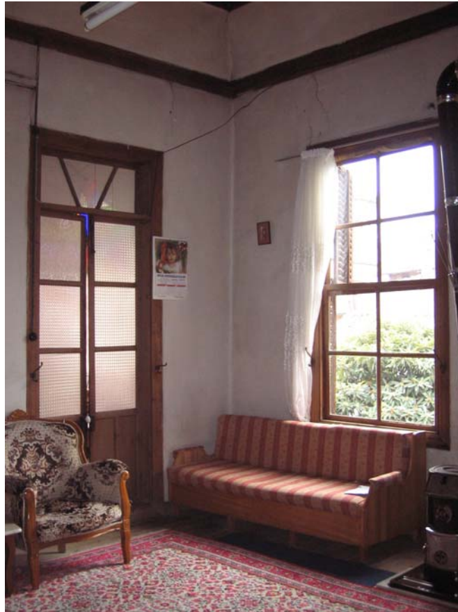
Şekil C.92. 112 Mekânı giriş kapısı ve avluya açılan penceresi