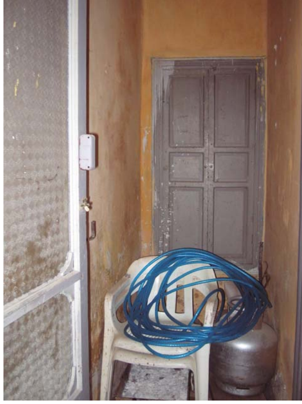
Şekil C.57. Z13 Mekânı güneydoğu duvarında yer alan dolap