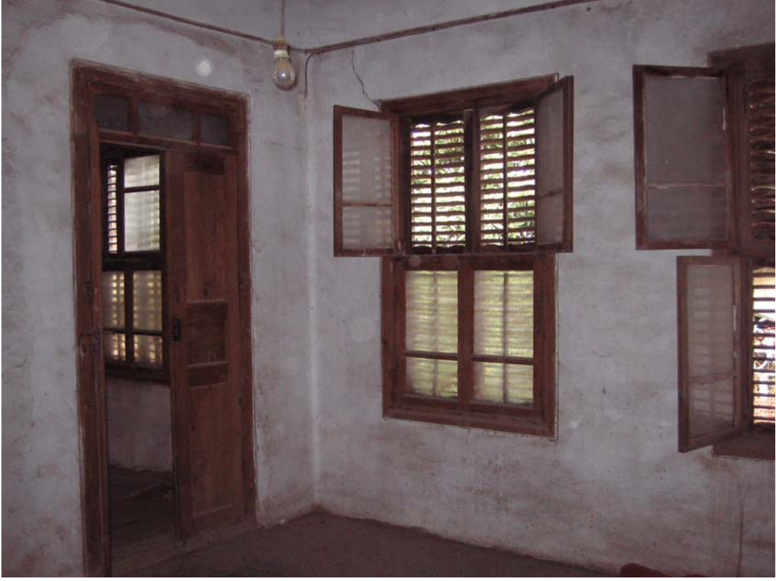
Şekil C.107. 118 Mekânı kuzeydoğu duvarı