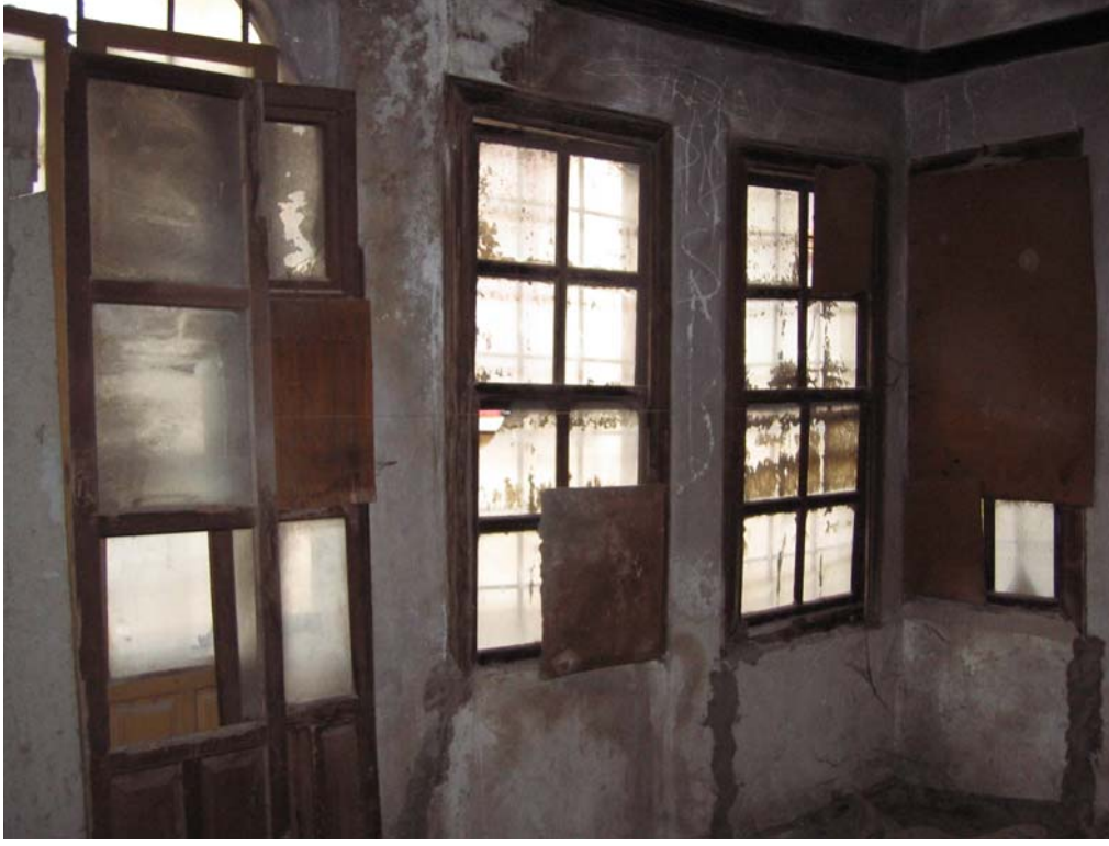
Şekil C.65. 101 Mekânı batı yönünden görünüşü