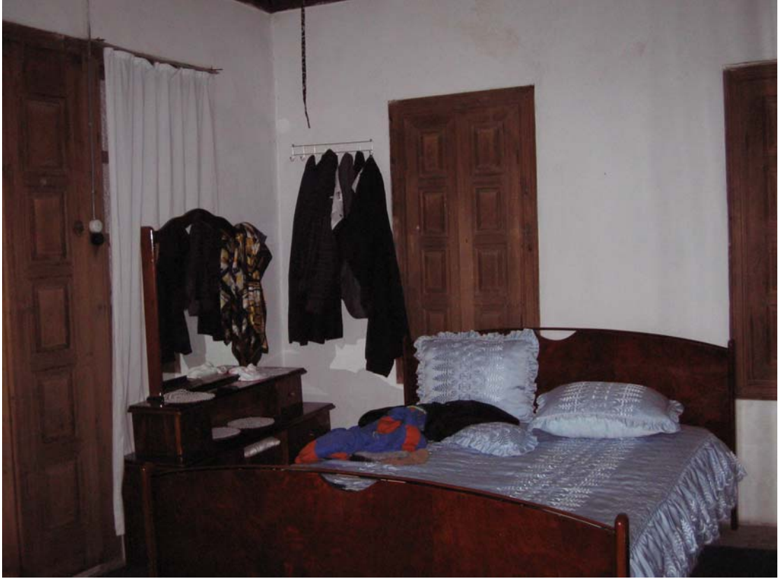
Şekil C.90. 109 Mekânı güneydoğu yönünden görünüşü