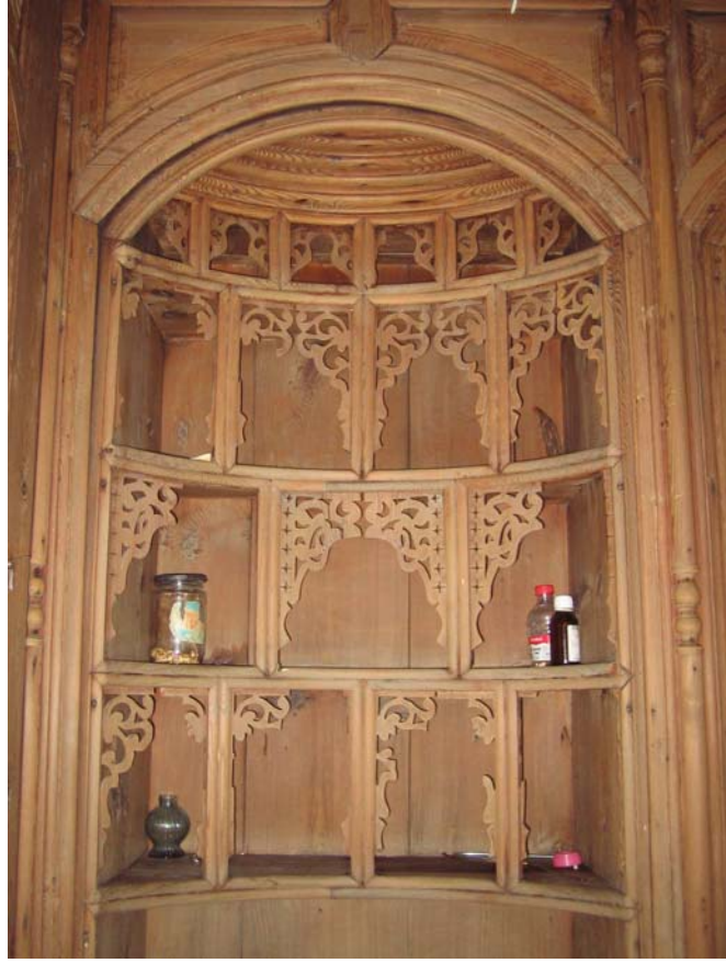
Şekil C. 38. Z08 Mekânı güneybatı duvarındaki kitabiye