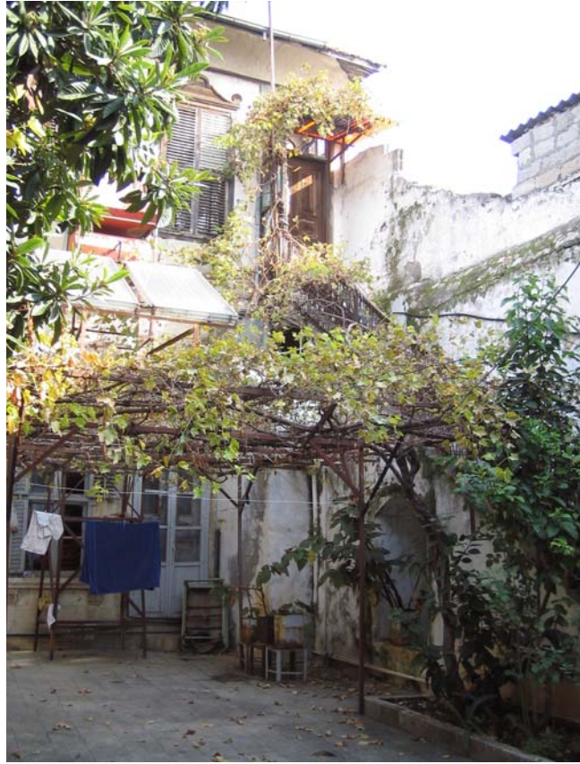
Şekil C.142. Avlu duvarının batı yönünden görünüşü