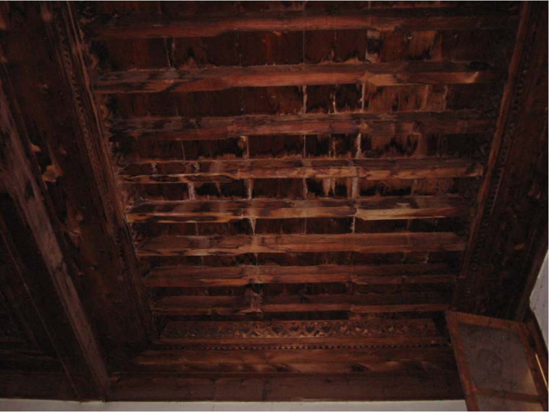
Şekil C.24. Z07 Mekânı tavanı