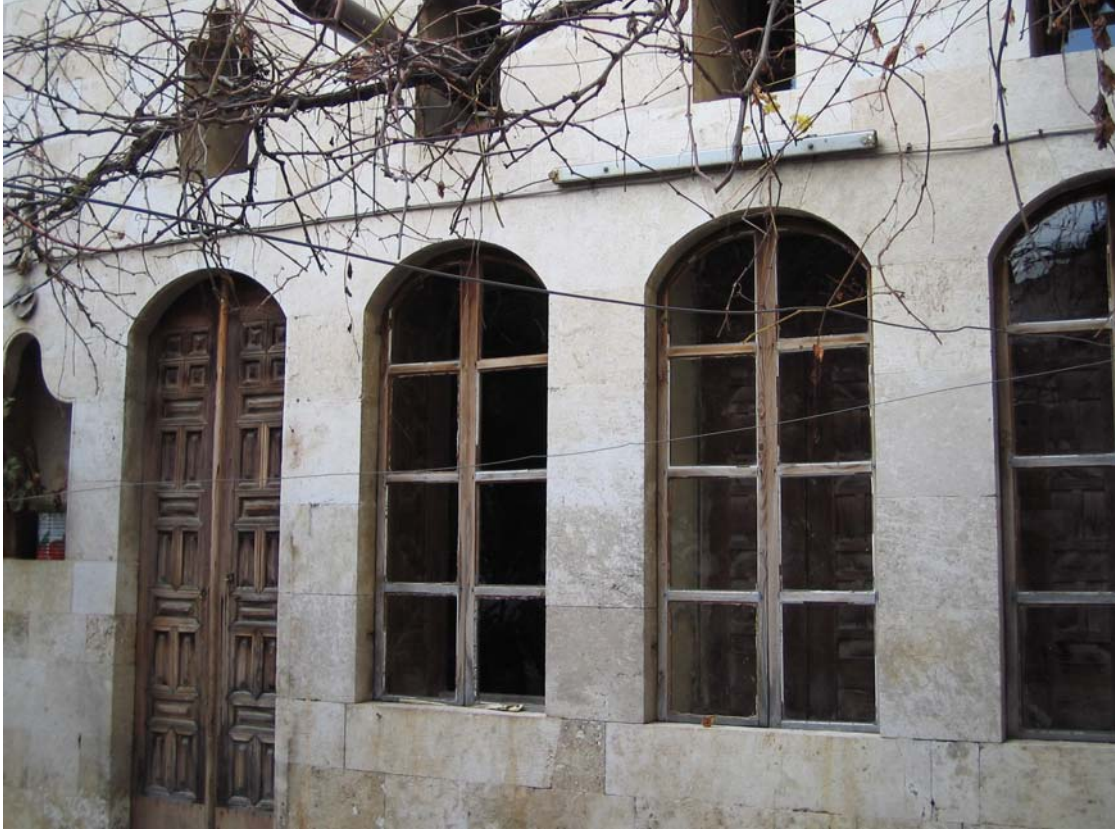
Şekil C.136. Avlu kuzeybatı cephesinde görülen aydınlatma elemanı