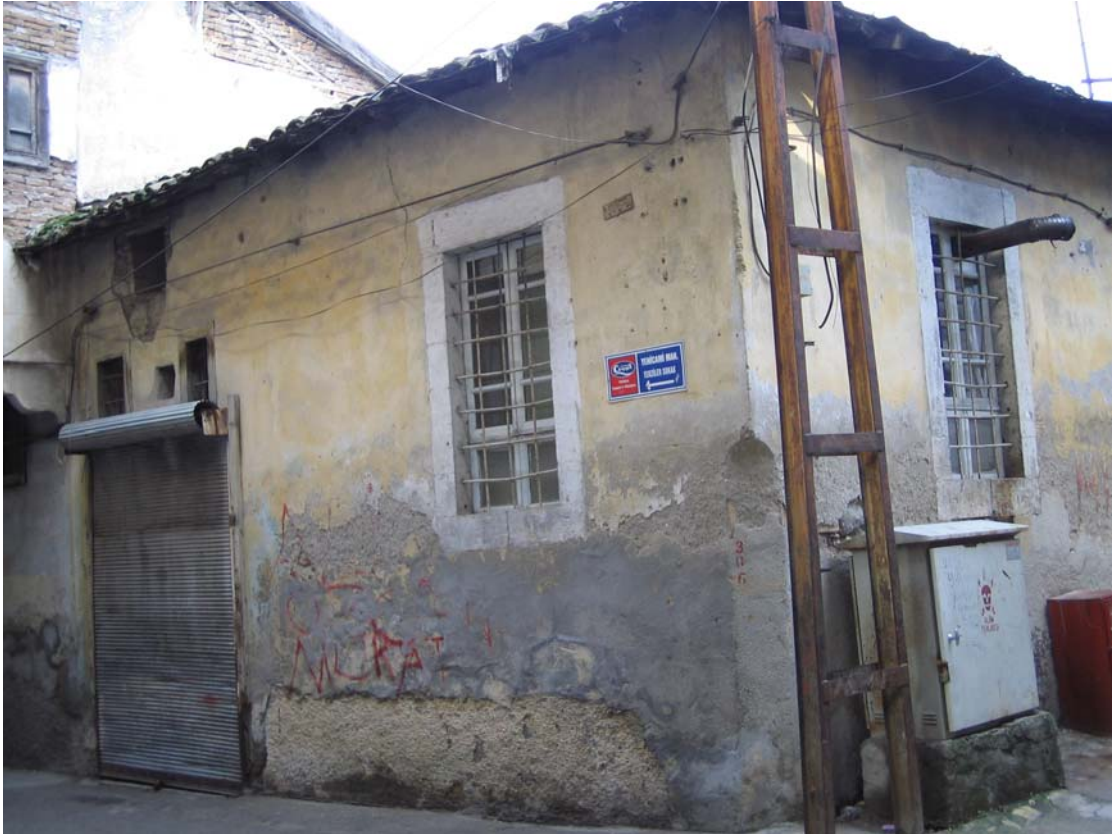
Şekil C.178. Yapının güneydoğu yönündeki komşusunun Terziler Sokak cephesi görünüşü