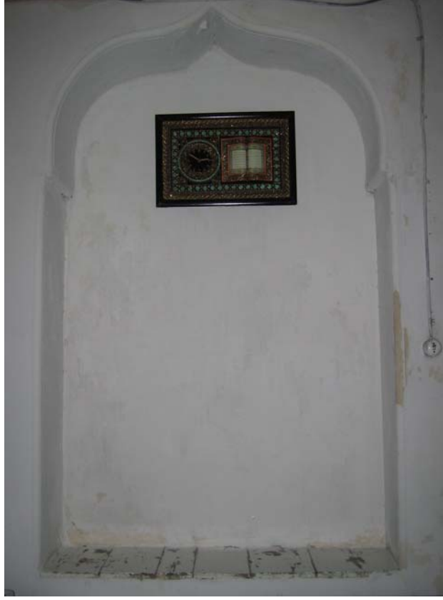
Şekil C.87. 108 Mekâni kuzeybatı duvarında yer alan niş