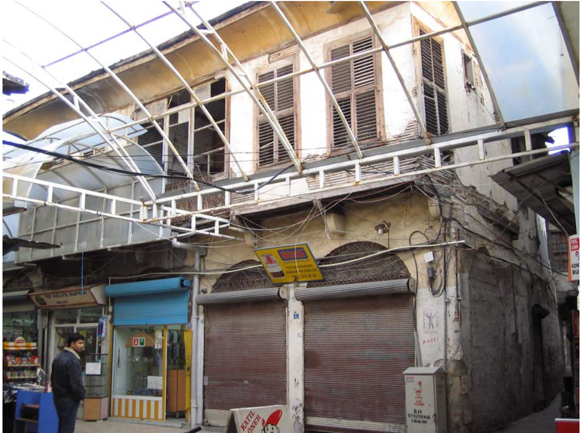
Şekil C.146. Kuzeybatı yönündeki komşu yapının batı yönünden görünüşü