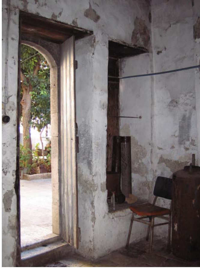
Şekil C.13. Z04 Mekânı batı yönünden görünüşü