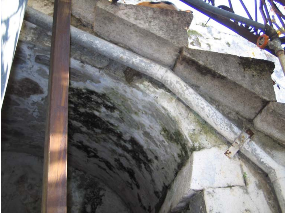
Şekil C.129. Avludaki kesme taş kemerin güneydoğu yönünden görünüşü