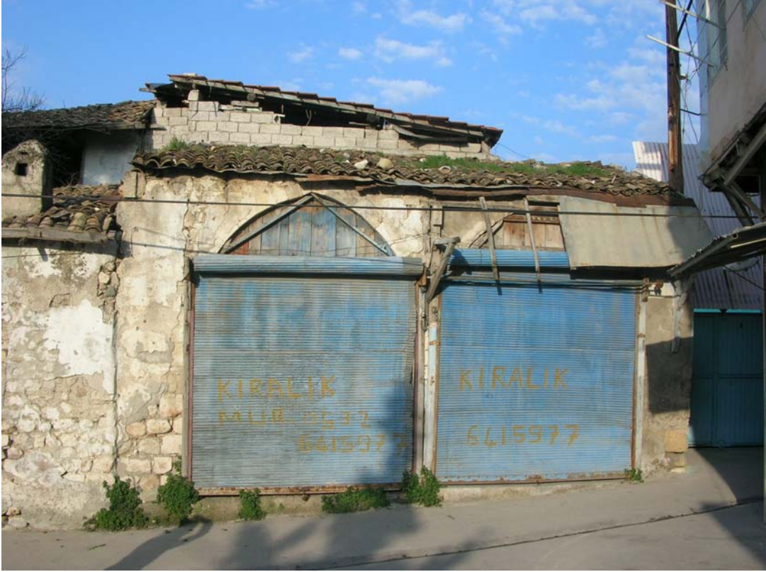
Şekil C.175. İplikpazarı Mahallesi, Halk Sokak, no:3A/3B’de görülen dükkân cephesi