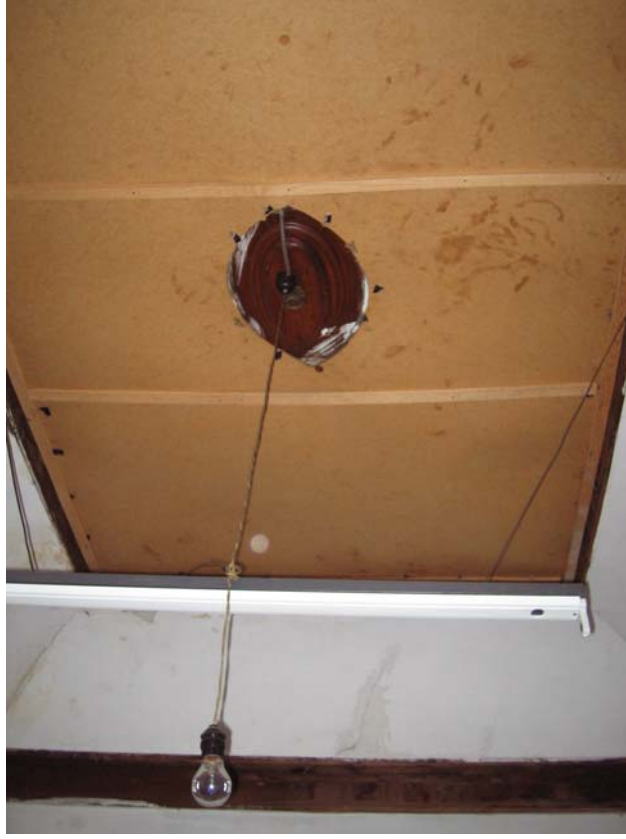
Şekil C.133. 107-Misafir odası tavan kaplaması