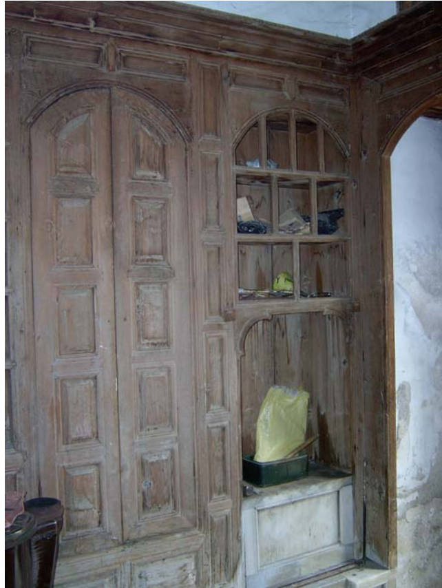
Şekil C.28. Z07 Mekânı kuzeydoğu duvarındaki kitabiyeye