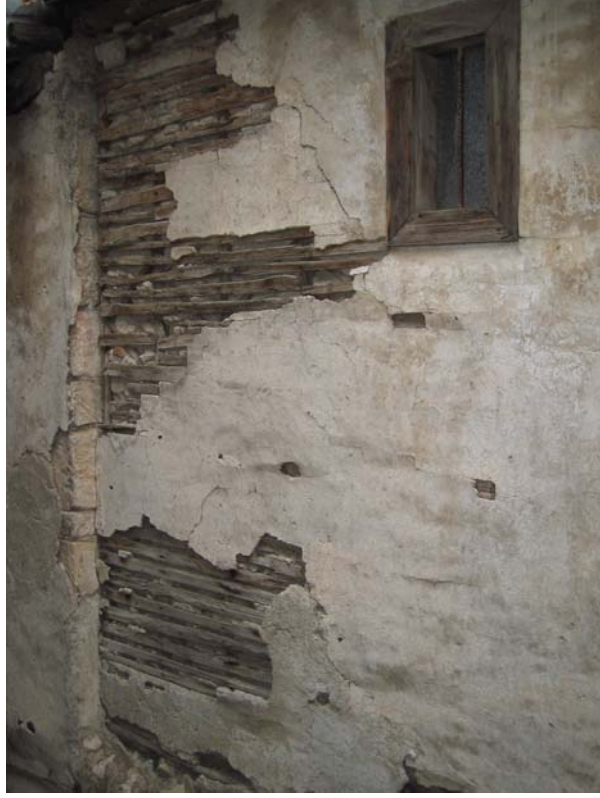
Şekil C.122. Yapının Terziler Sokak cephesinde görülen bağdadi çıtalar