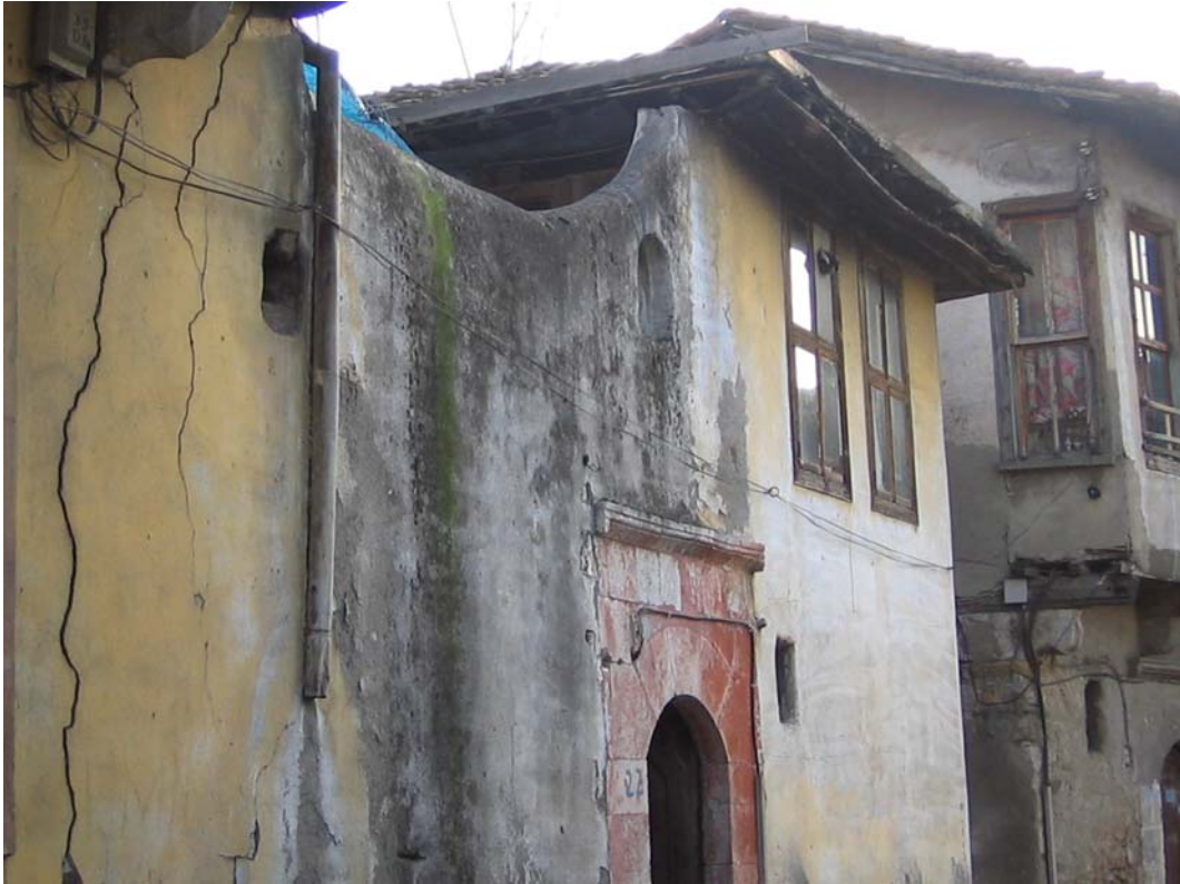
Şekil C.164. Akbaba Mahallesi, Çankaya Sokak, No:22'deki yapının avlu duvarının kuzey yönünden görünüşü