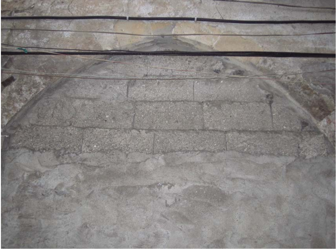
Şekil C.174. Kuzeybatı yönündeki, Uzun Çarşı Caddesi'ne yakın konumlanan komşu dükkânın kesme taş kemer izleri