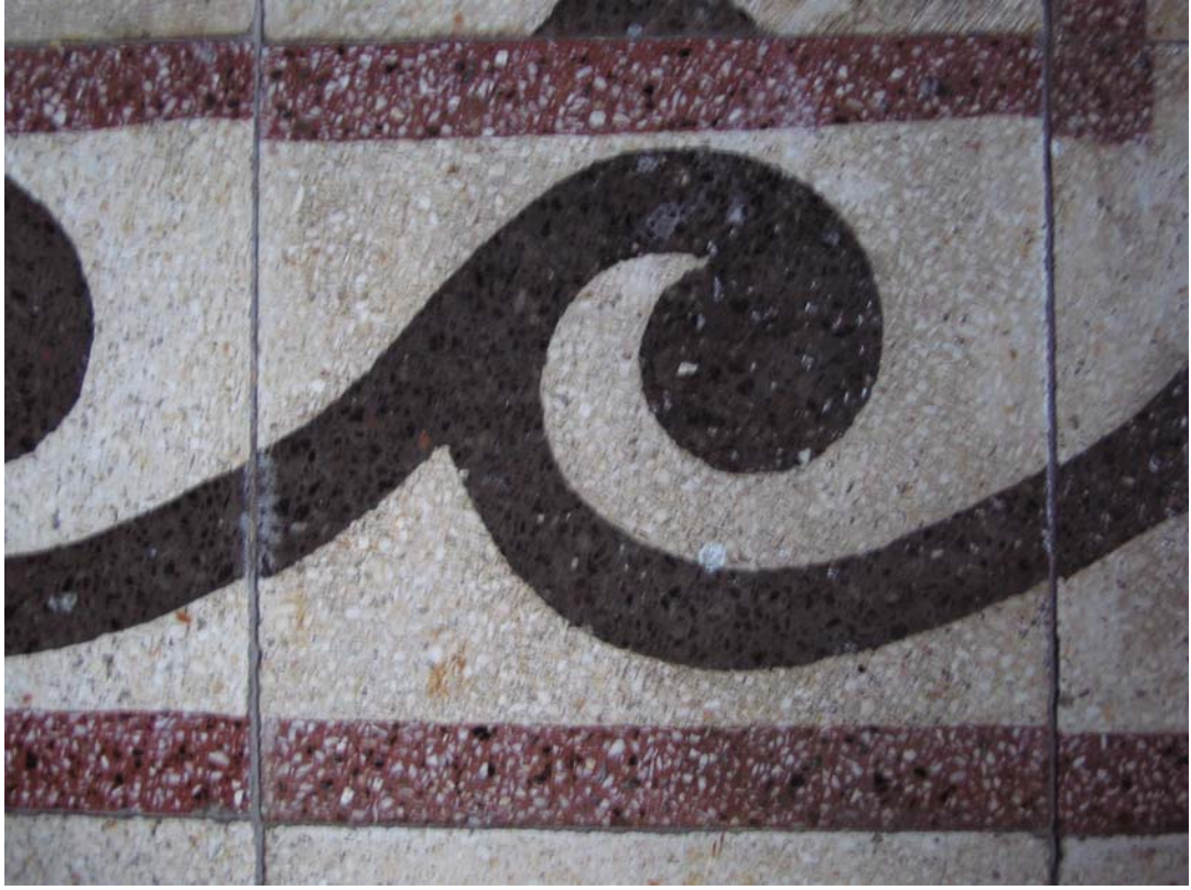
Şekil C.32. Z08 Mekânı terrazzo kenar sutaşı deseni