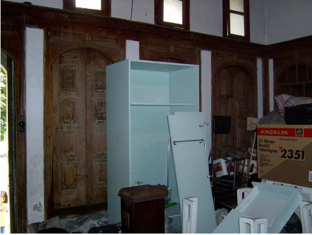
Şekil C.29. Z07 Mekânı'nda avluya açılan pencereler