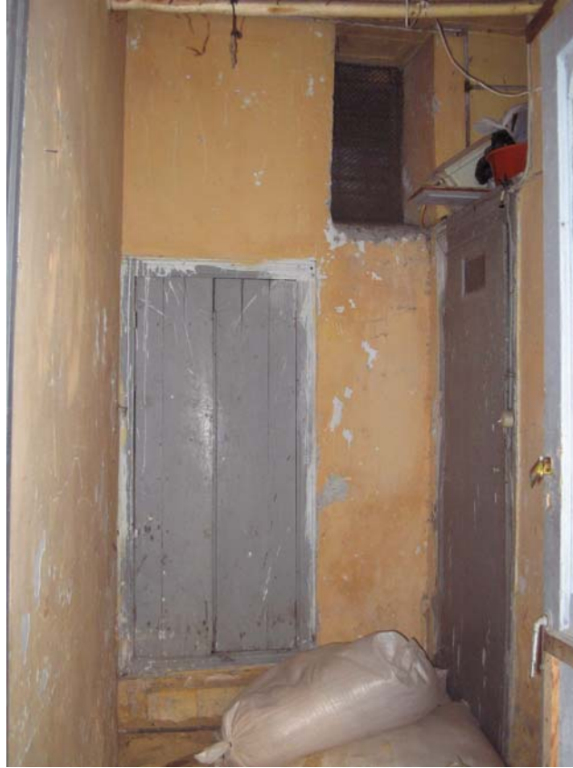
Şekil C.56. Z13 Mekânı giriş kapısından görünüşü