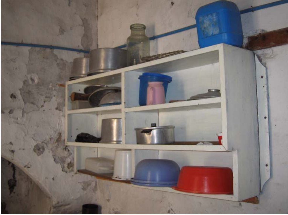
Şekil C.149. Z04-Mutfakta yer alan geç dönem eki raflar