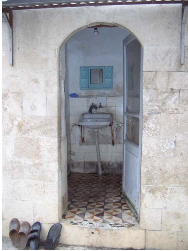
Şekil C.63. Z17 Mekâmı avlu cephesi