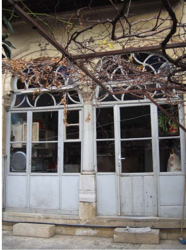
Şekil C.138. Avlu kuzeydoğu cephesindeki ahşap kapılarda (KZ13,KZ14) görülen ekler