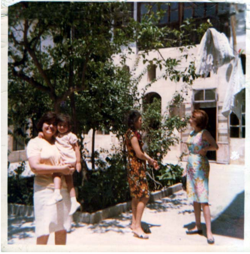
Şekil C.159. Avlu kuzeybatı cephesi (1975)