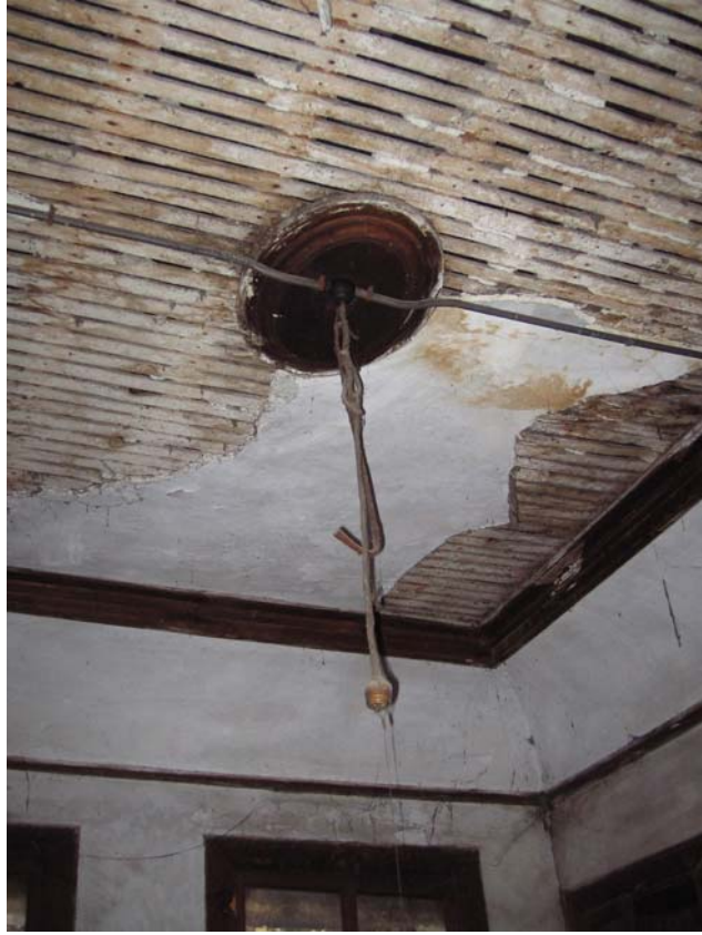
Şekil C.124. 103-Misafir odası tavanı