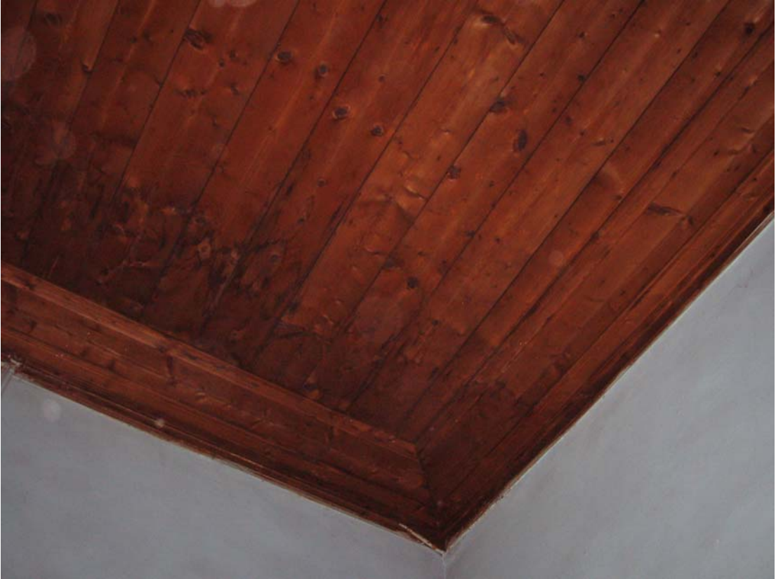
Şekil C.48. Z11 Mekânı tavanı