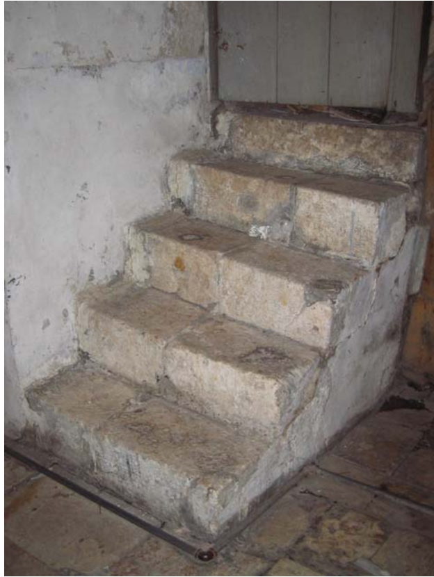
Şekil C.6. Giriş taşlığındaki taş basamaklar