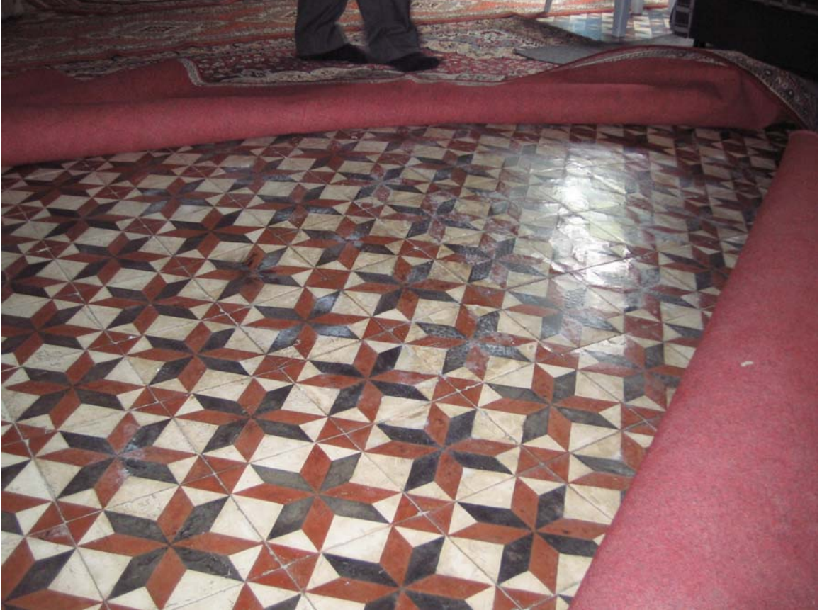
Şekil C.189. Z09 Mekânı kabarmış döşemesi