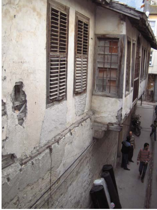
Şekil C.185. Terziler Sokak cephesi 103 mekânı ve çıkma görünüşü