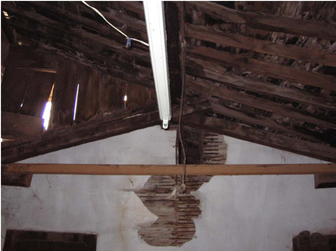
Şekil C.158. 104 Mekânı kesilmiş çatı makası