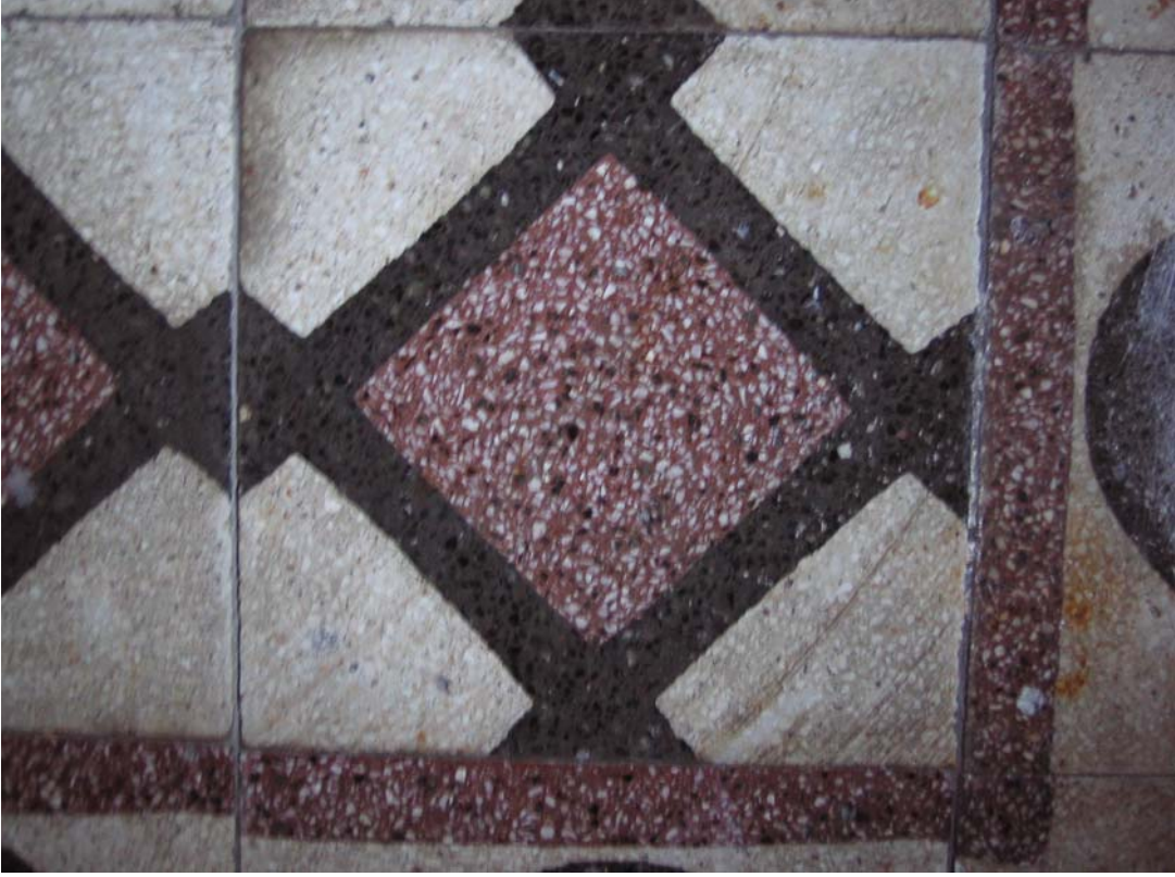
Şekil C.31. Z08 Mekânı terrazzo deseni