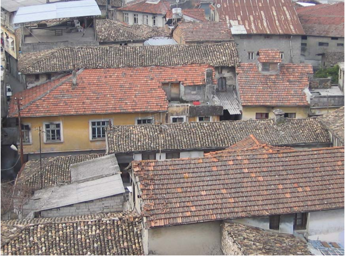
Şekil C.128. Terziler Sokak'taki komşu yapıların çatılarının kuzeydoğu yönünden görünüşü