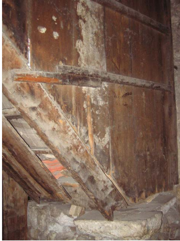
Şekil C.12. Z03 Mekânı'nda görülen ahşap levha destekleri