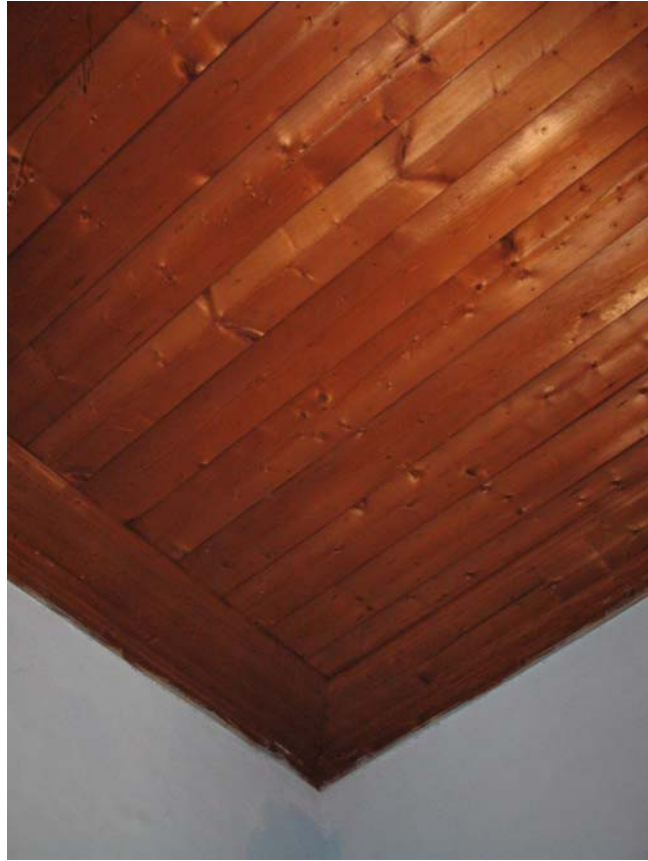
Şekil C.40. Z09 Mekânı tavanı