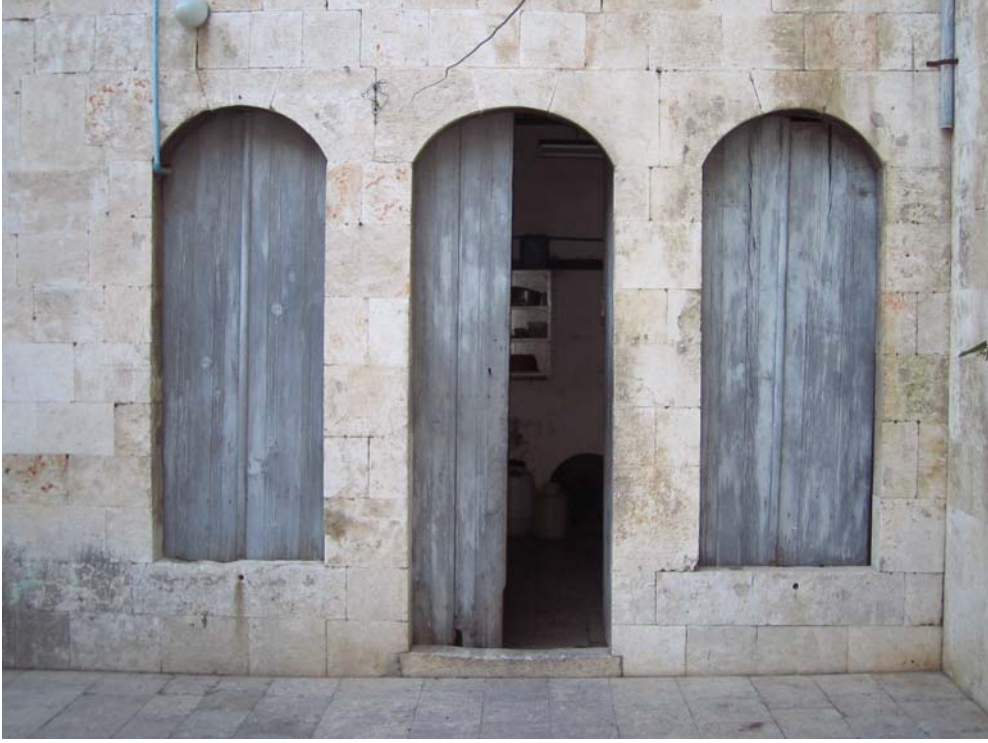
Şekil C.120. Z04-Mutfak mekânı avlu cephesi