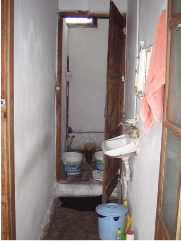
Şekil C.100. 114 Mekânı kuzeydoğu yönünden görünüşü