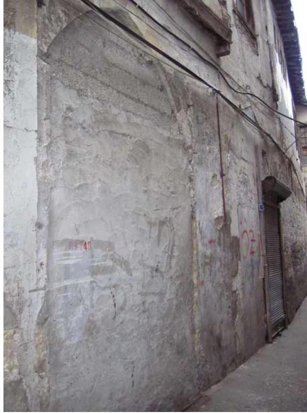
Şekil C.171. Kuzeybatı yönündeki komşu yapının zemin kat dükkânlarının Uzun Çarşı Caddesi'nden görünüşü