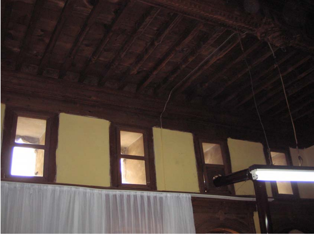
Şekil C.33. Z08 Mekânı tavanı