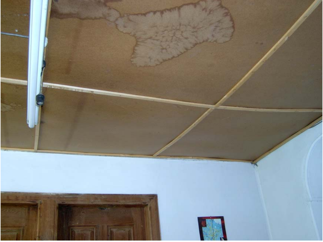
Şekil C.89. 108 Mekânı tavanı