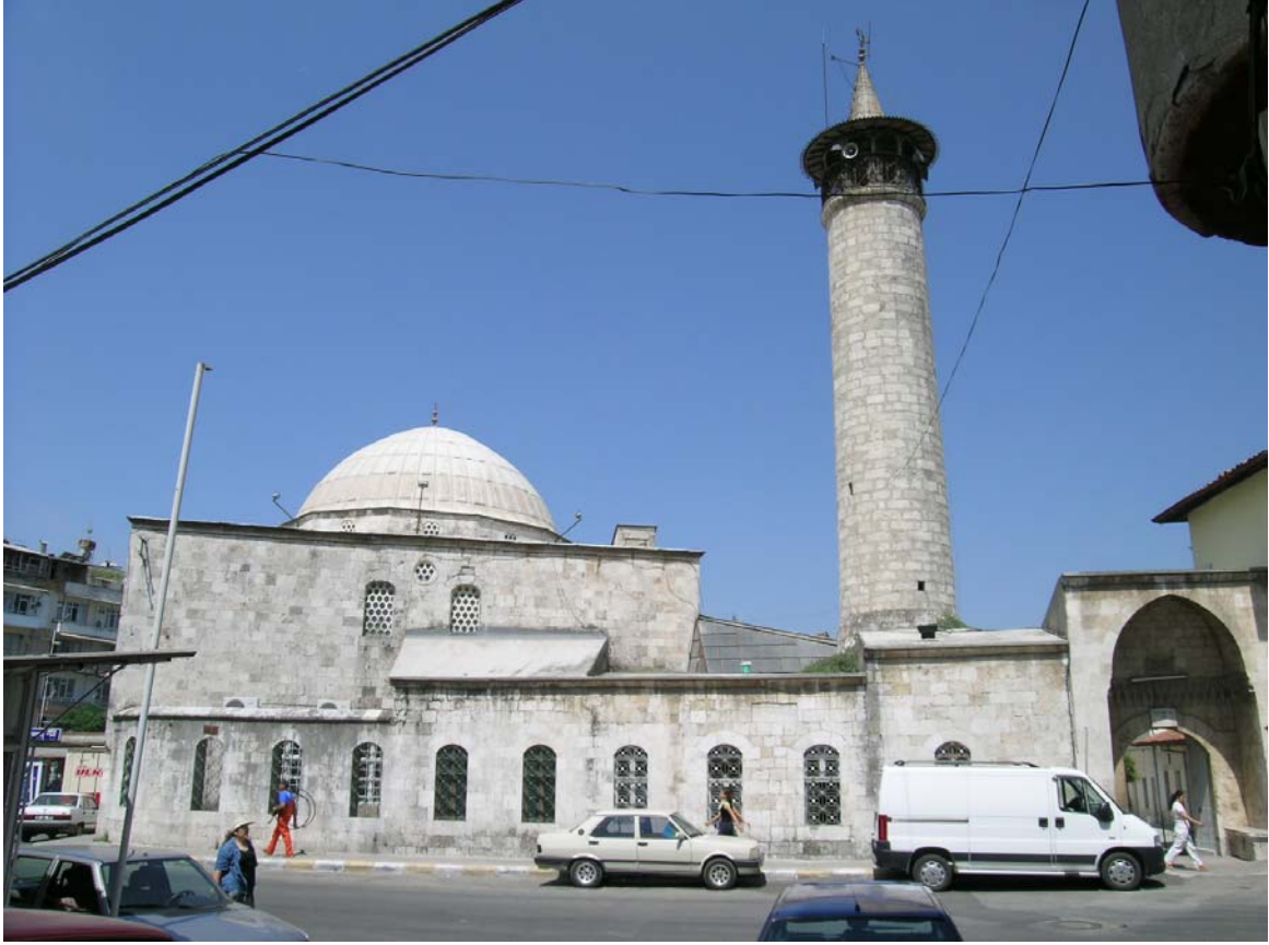
Şekil B.1. Habib'in Neccar Camii giriş cephesi