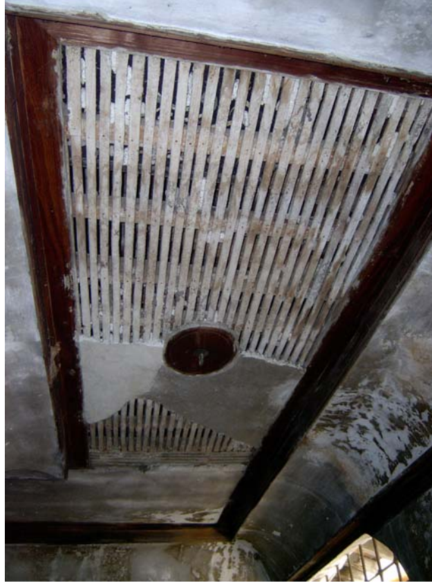
Şekil C.123. 101-Sofa mekânı tavanı