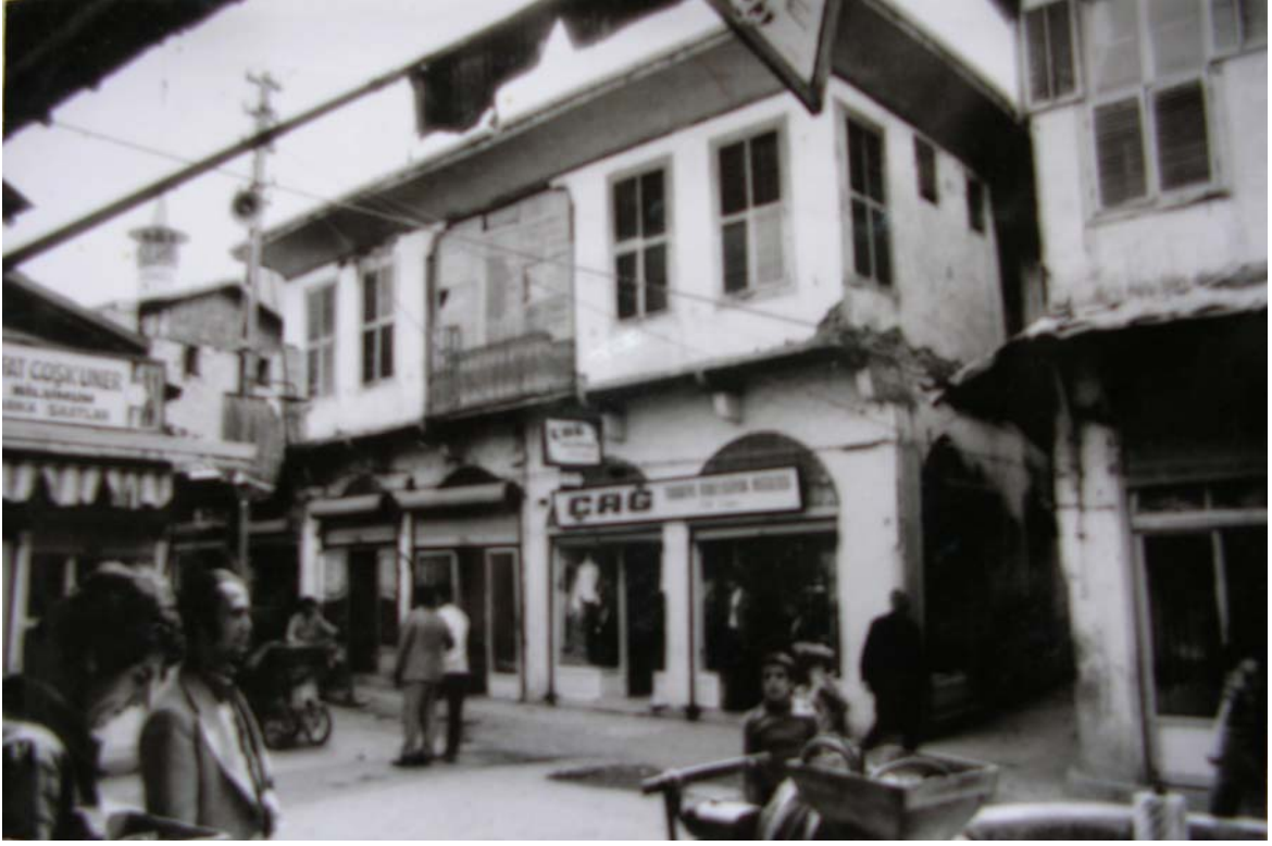
Şekil C.145. Kuzey yönünde yer alan tescilli binanın Uzun Çarşı sokak cephesi (1978)