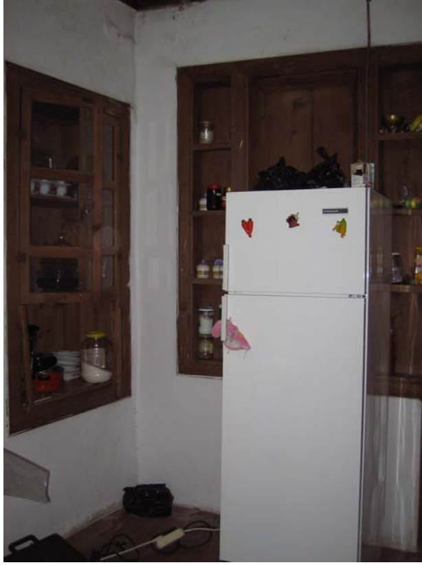
Şekil C.79. 106 Mekânı kuzeydoğu duvarında yer alan niş ve raflar