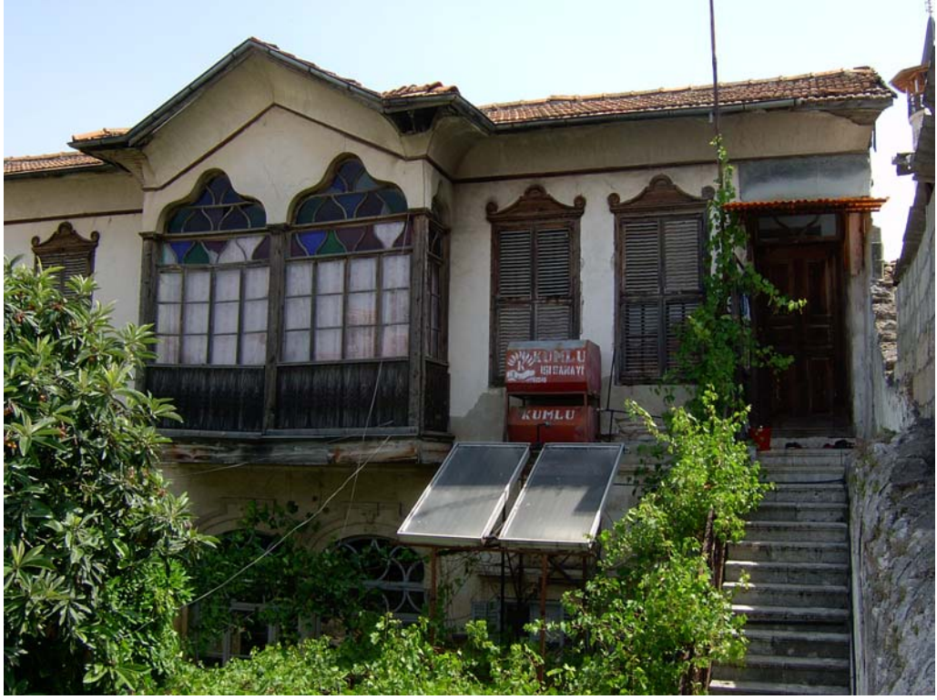
Şekil C.3. Yapının kuzeydoğu yönünde konumlanan, 1920 yılında satın alınan kütlesinin güney yönünden görünüşü