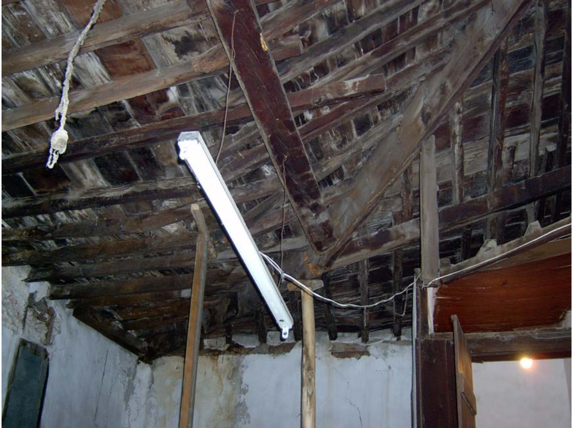
Şekil C.127. 104 Mekânı tavanı