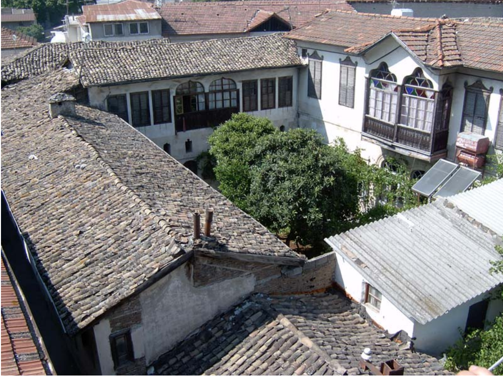
Şekil C.1. Yapının güney yönünden kuşbakışı görünüşü