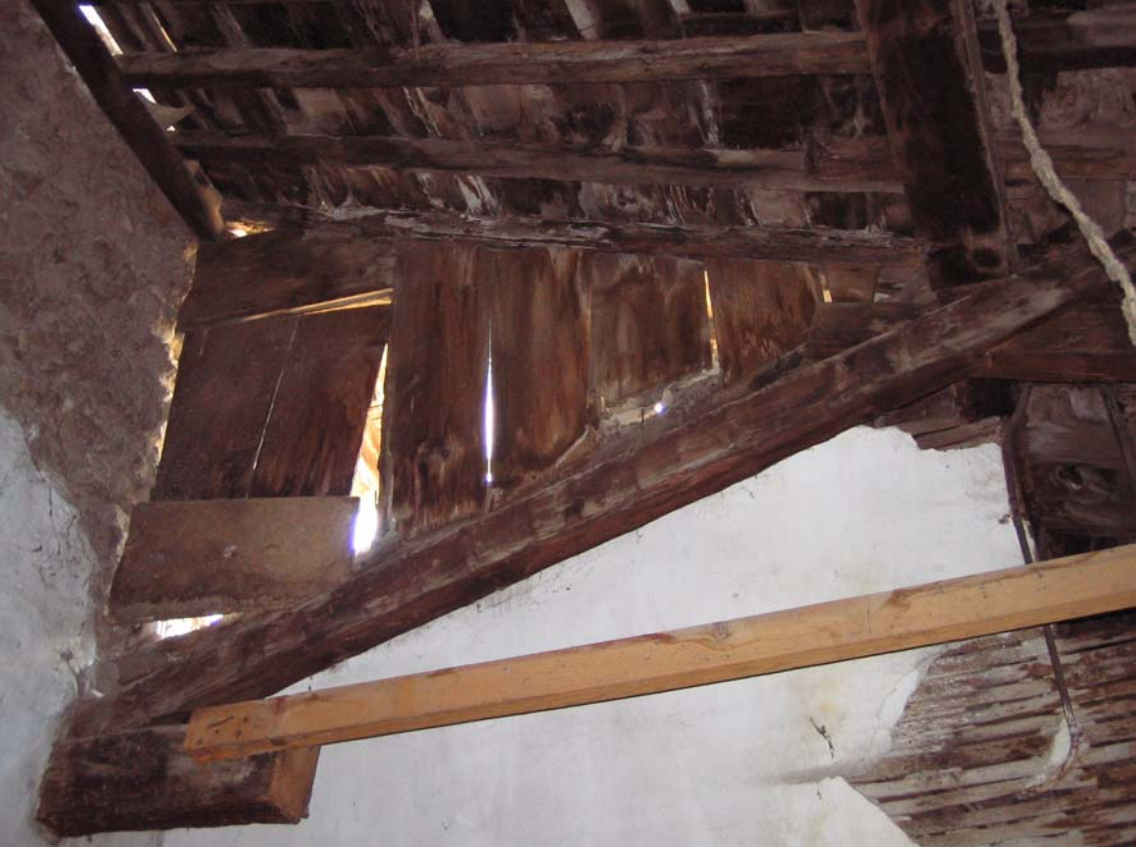
Şekil C.188. 104 Mekânı kesilmiş çatı mertegi