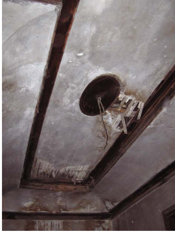
Şekil C.69. 101 Mekânı tavanı