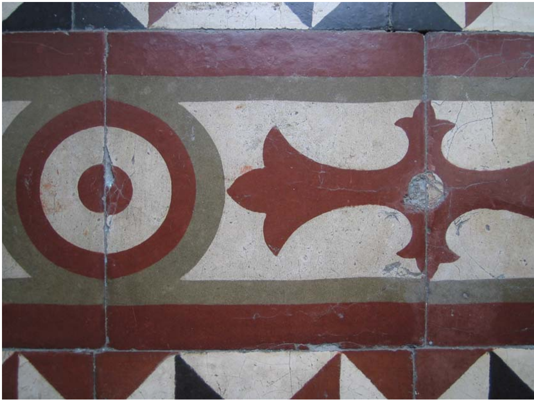
Şekil C.42. Z09 Mekânı terrazzo kenar sutaşı deseni