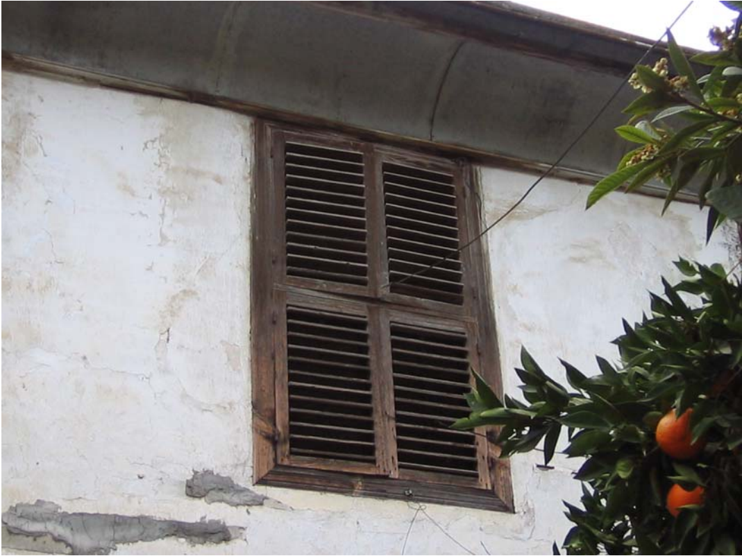
Şekil C.162. Avlu güneybatı cephesi P145 kod numaralı pencere görünüşü