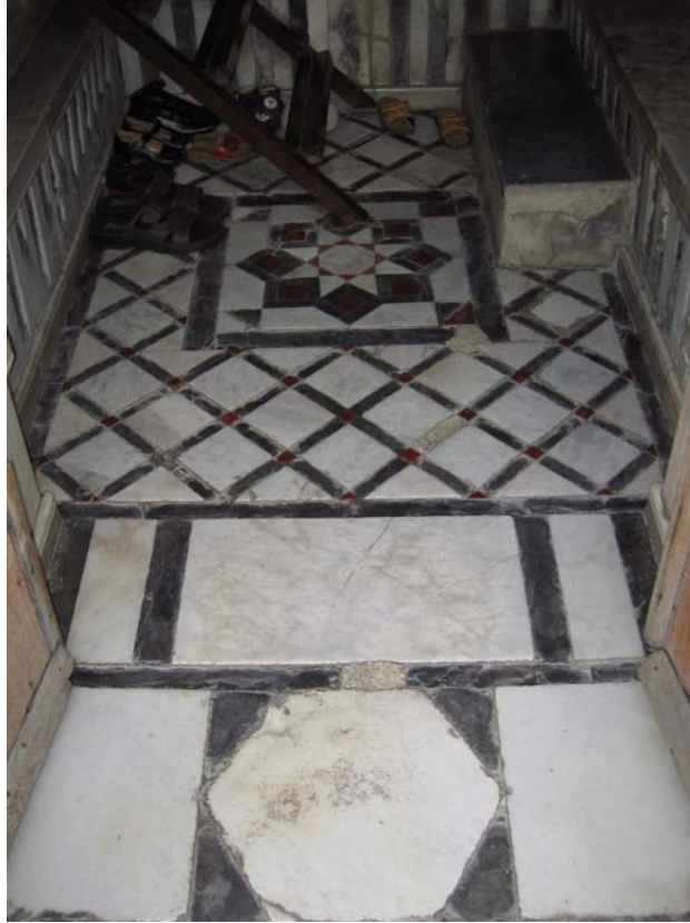
Şekil C.30. Z08 Mekânı eşikliği