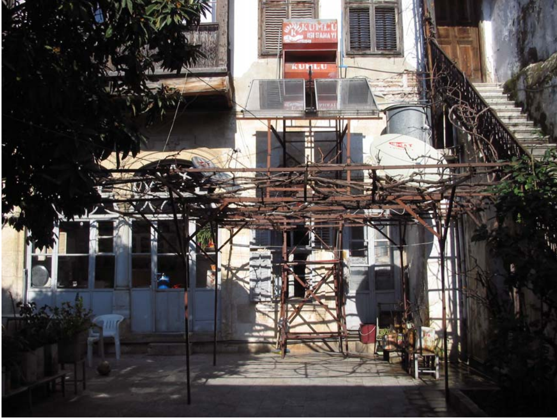
Şekil C.163. PZ15 ve KZ16 avlu cephesi görünüşü