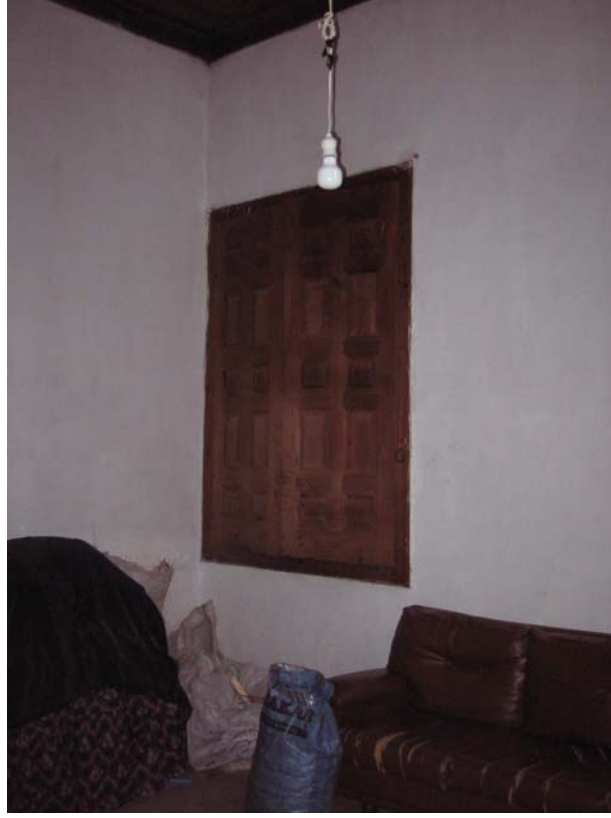
Şekil C.103. 115 Mekânı kuzeydoğu duvarında yer alan dolap