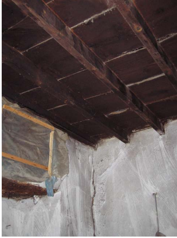
Şekil C.17. Z05 Mekânı tavanı