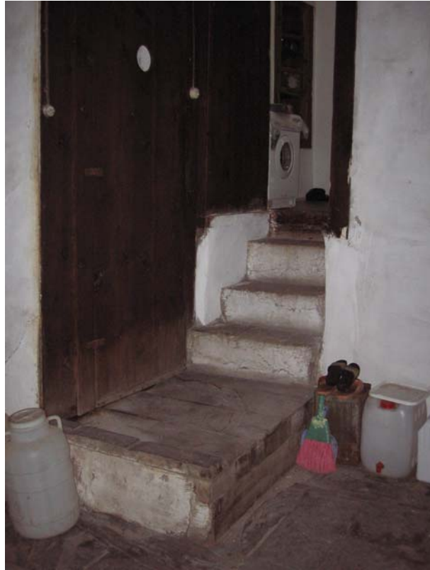
Şekil C.80. 106 kod numaralı mekânın güneybatı duvarında yer alan, 104 kod numaralı mekâna geçişi sağlayan basamaklar