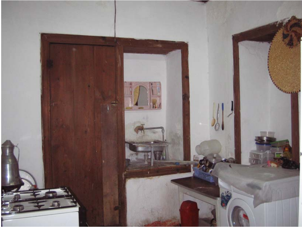
Şekil C.78. 106 Mekânı'nın giriş kapısından görünüşü