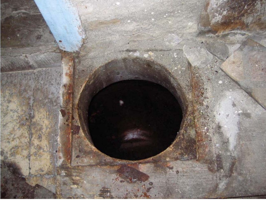
Şekil C.151. Z04-Mutfağın kuzey köşesindeki su haznesi