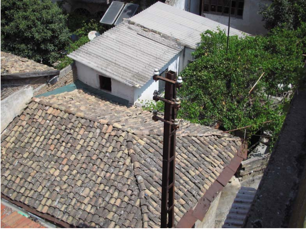
Şekil C.143. Güneydoğu yönündeki geç dönem niteliksiz ekler