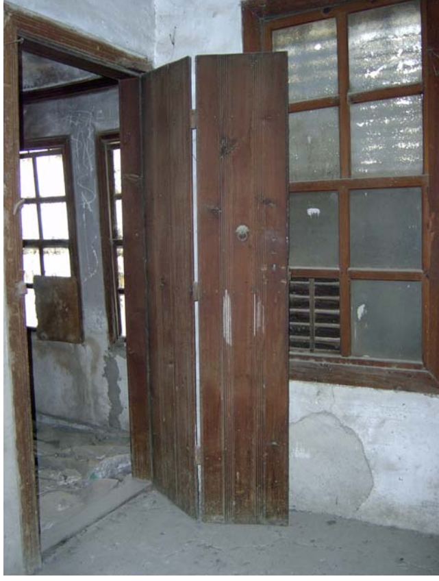
Şekil C.71. 103 Mekânı giriş kapısı