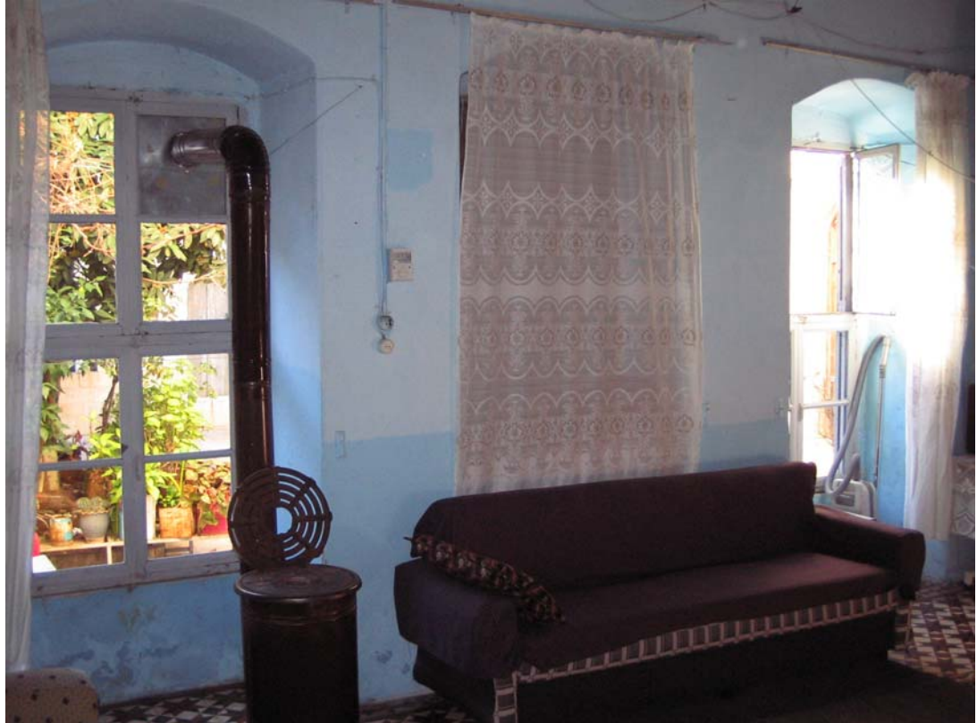
Şekil C.44. Z09 Mekânı güneybatı duvarı