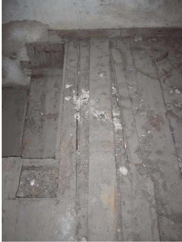
Şekil C.68. 101 Mekânı döşemesinde görülen kopmalar