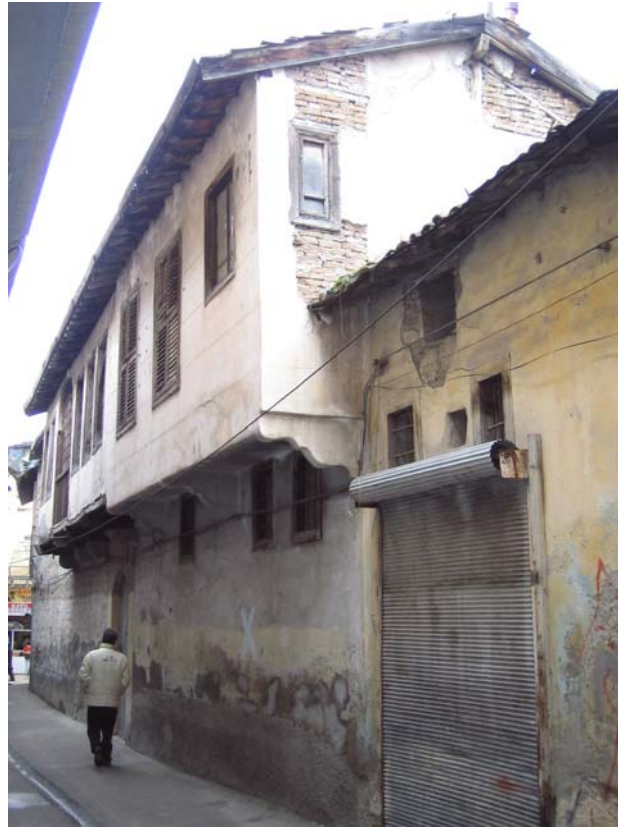
Şekil C.168. Terziler Sokak cephesinin Yeni Cami Sokak'tan görünüşü