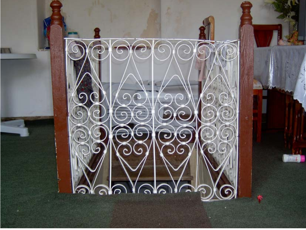
Şekil C.115. 108 kod numaralı mekânda yer alan özgün ferforje korkuluğun güneydoğu yönünden görünüşü