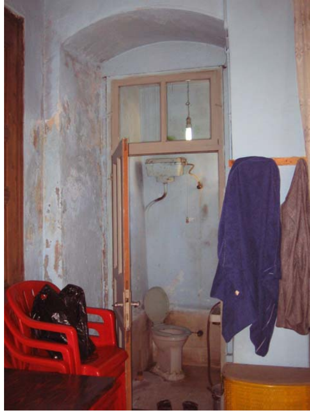
Şekil C.54. Z12 Mekânı güney yönünden görünüşü