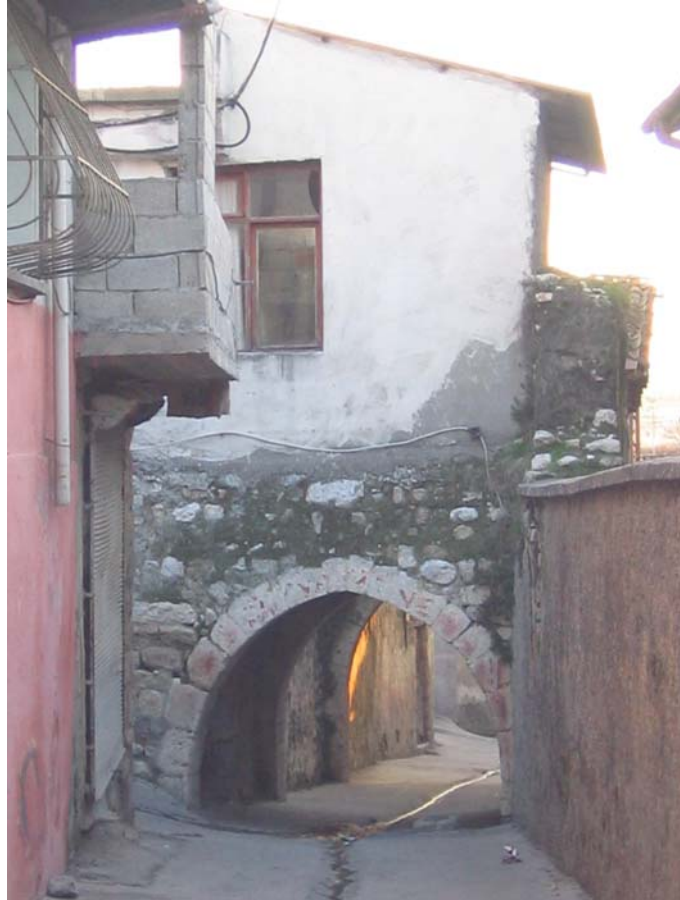
Şekil A. 6. Efeler Sokak'tan bir "kabalıtı"