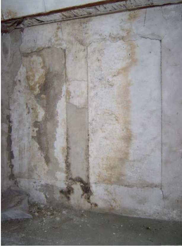
Şekil C.156. 103 Mekânı kuzeydoğu duvarındaki doldurulmuş pencereler