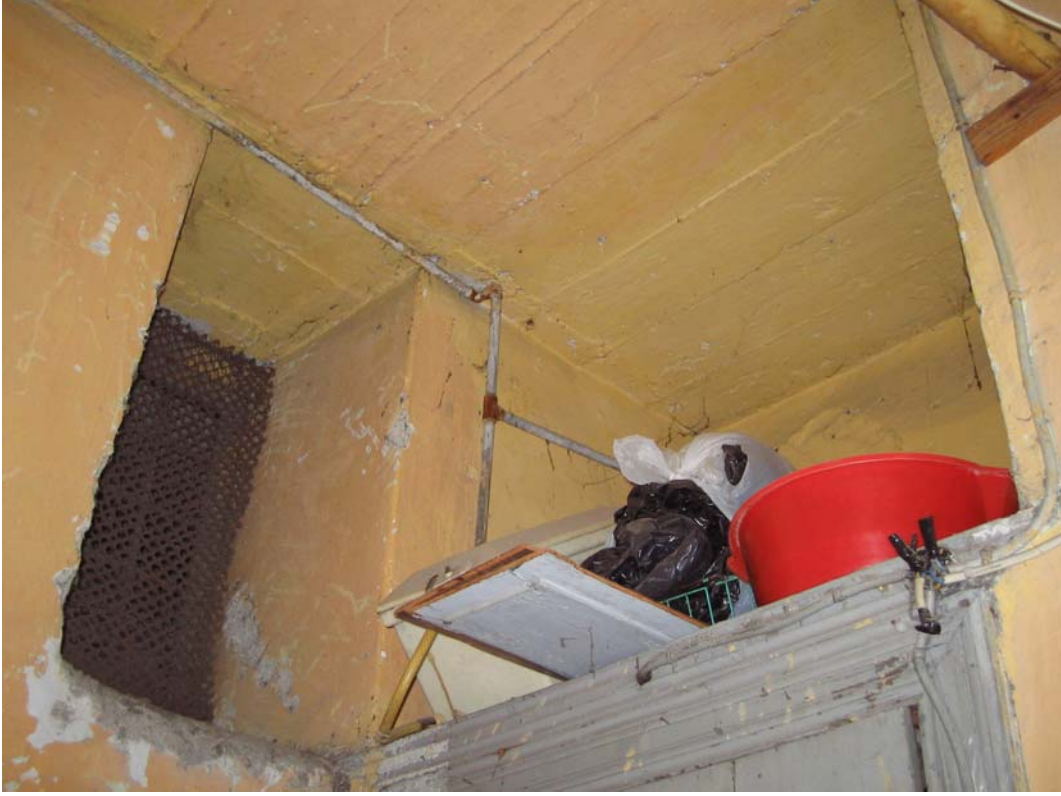
Şekil C.55. Z13 Mekânı tavanı