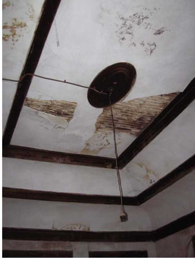
Şekil C.126. 119-Yatak odası tavanı