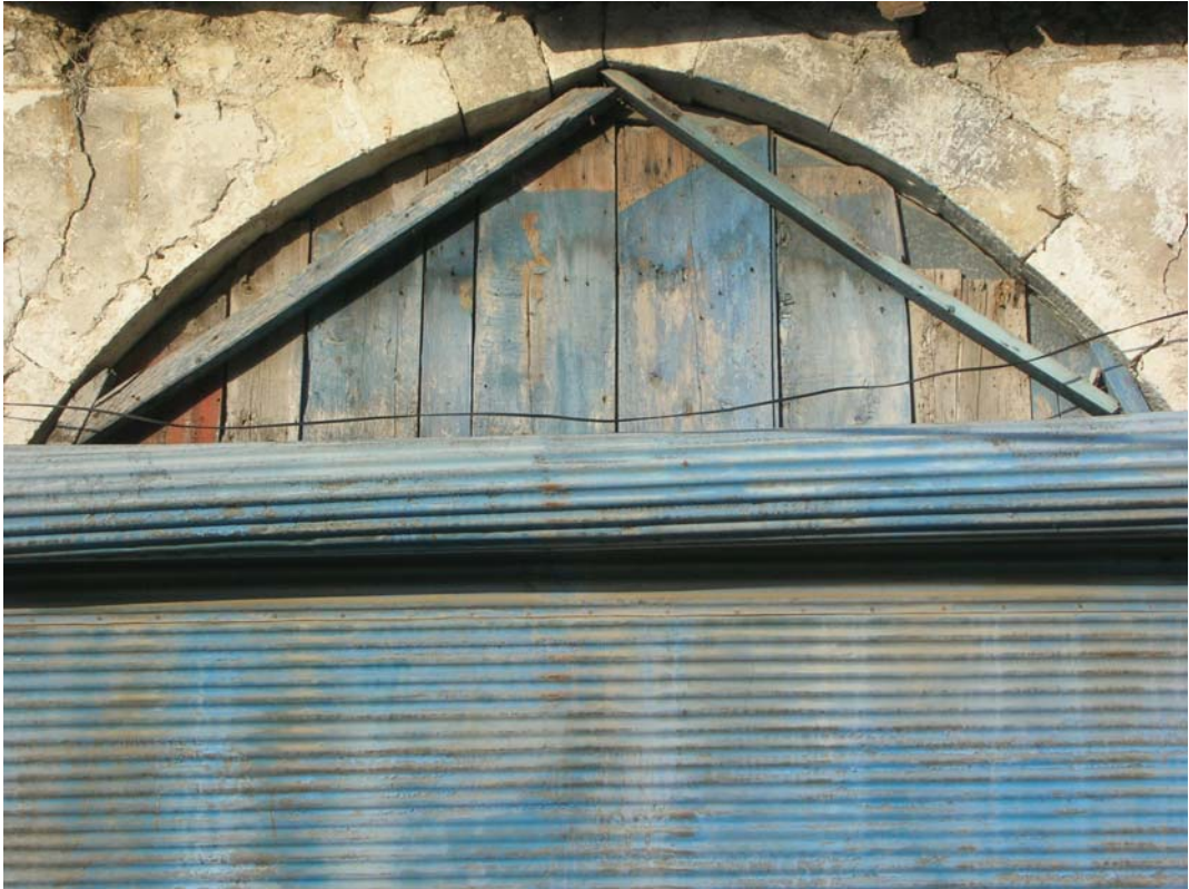
Şekil C.176. İplikpazarı Mahallesi, Halk Sokak, no:3A/3B’de görülen dükkân cephesindeki ahşap kaplama