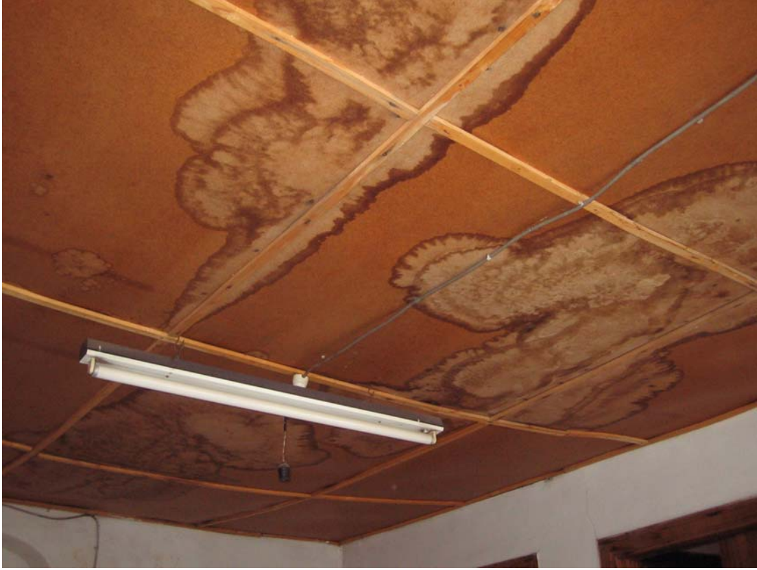
Şekil C.157. 108-Sofa Mekânı tavan kaplaması