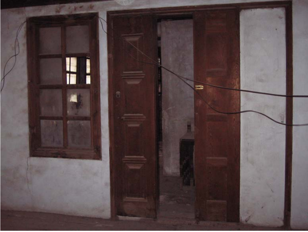
Şekil C.111. 119 Mekânı kuzeybatı duvarındaki kapının açılışı