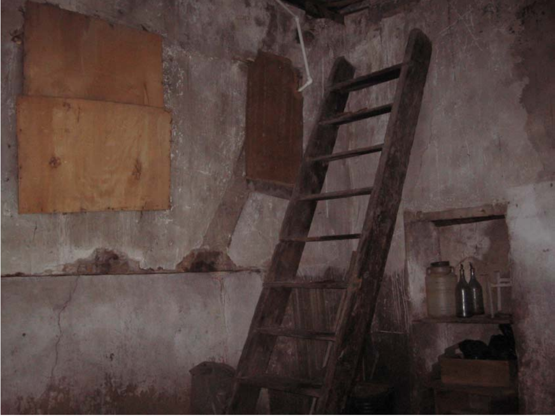
Şekil C.20. Z06 Mekânı güneybatı duvarındaki iz