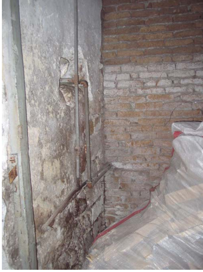
Şekil C.9. Z02 Mekânı güneydoğu duvarı