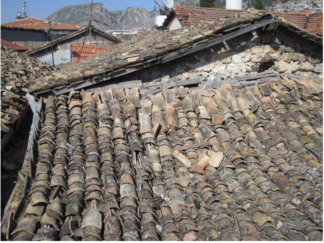
Şekil C.187. 104 Mekânı çatısının kuzeydoğu yönünden görünüşü