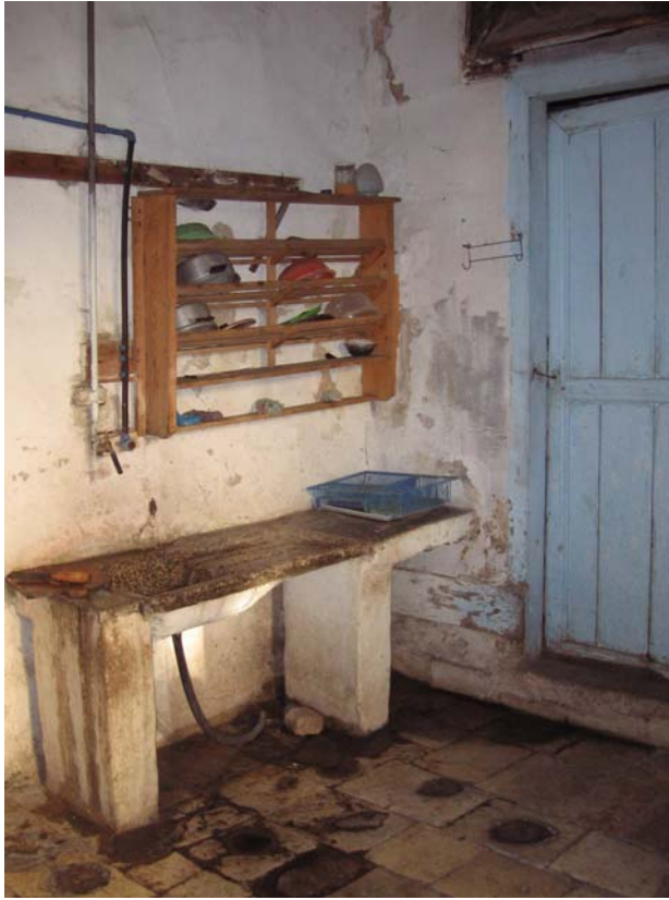
Şekil C.148. Z04-Mutfakta yer alan geç dönem eki lavabo