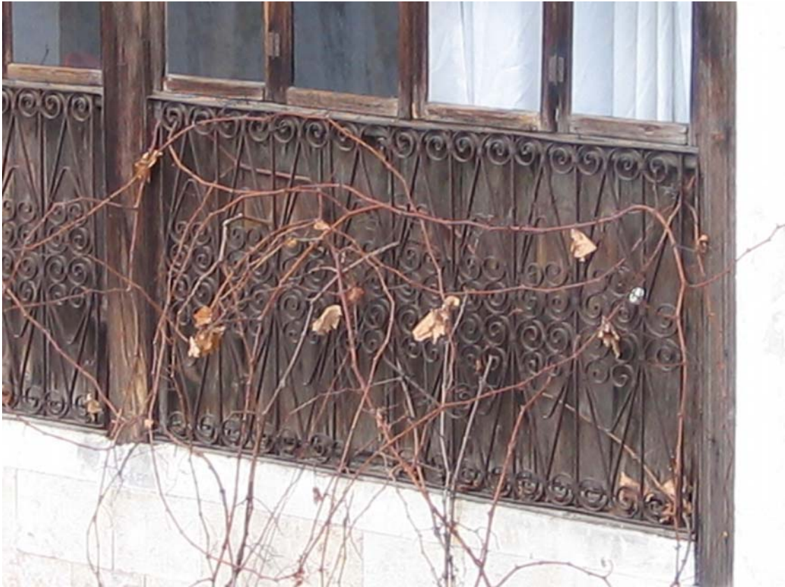
Şekil C.86. 108 Mekânı avlu cephesinde yer alan korkuluklarının 110 Mekânı'ndan görünüşü