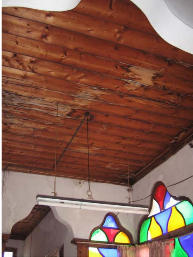
Şekil C.98. 112 Mekânı tavanı