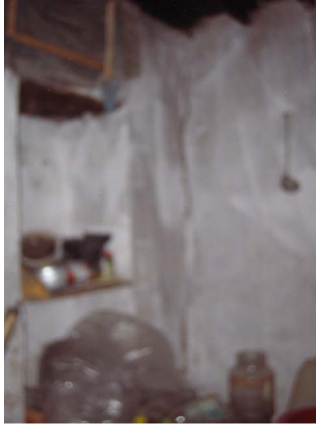
Şekil C.16. Z05 Mekânı doğu yönünden görünüşü