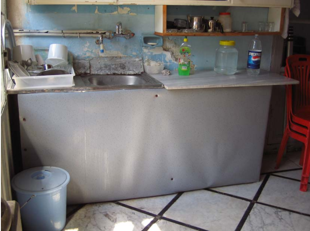
Şekil C.131. Z10-Mutfak mekânı kuzeybatı duvarındaki tezgâh