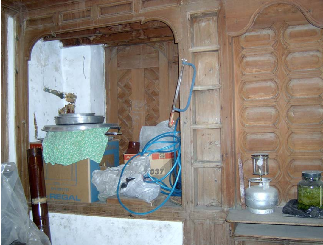
Şekil C.26. Z07 Mekânı kuzeydoğu duvarındaki mahmel