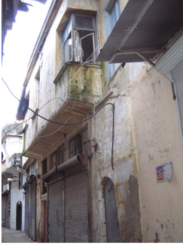
Şekil C.147. 1464 numaralı parselde yer alan komşu kâgir yapı