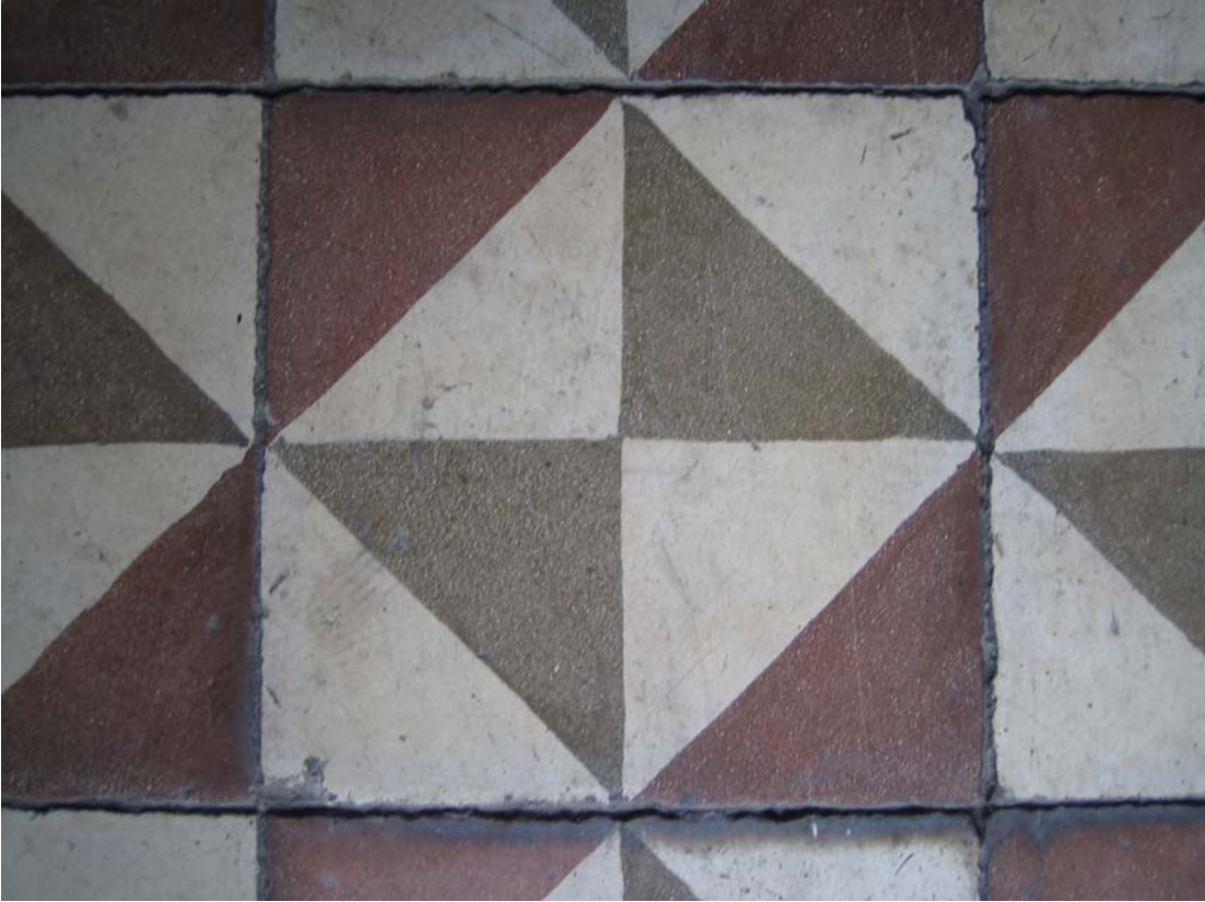
Şekil C.58. Z13 Mekânı terrazzo deseni