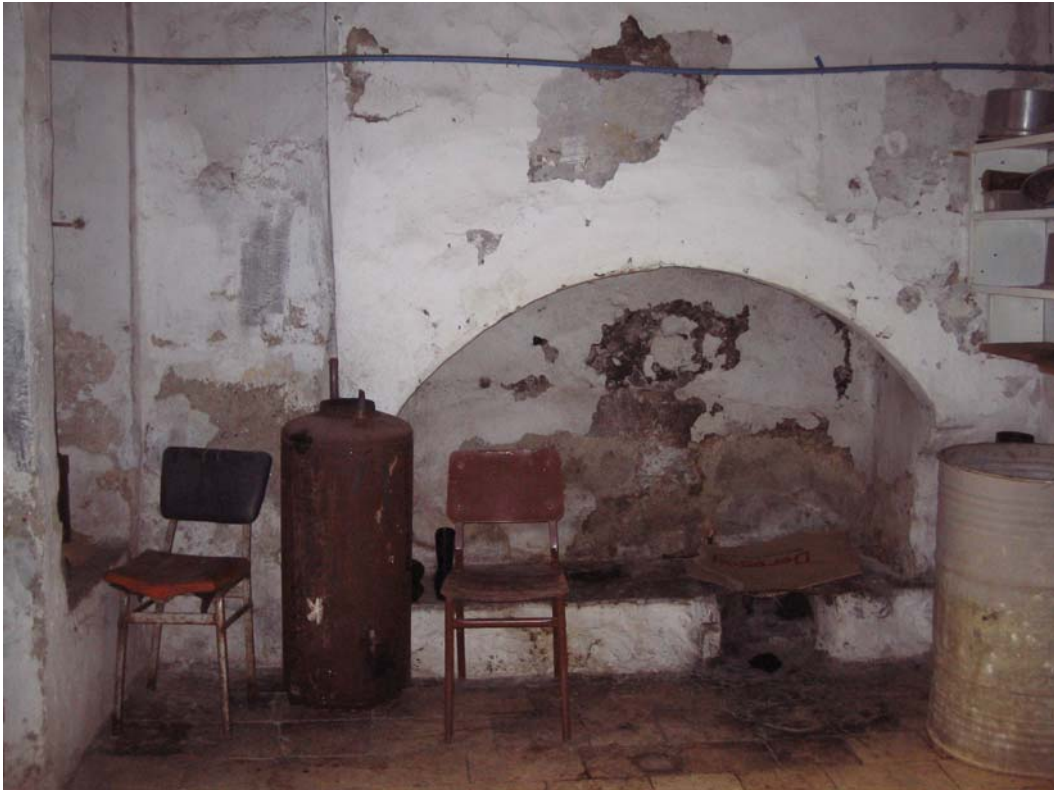
Şekil C.14. Z04 Mekânı'nda yer alan ocak