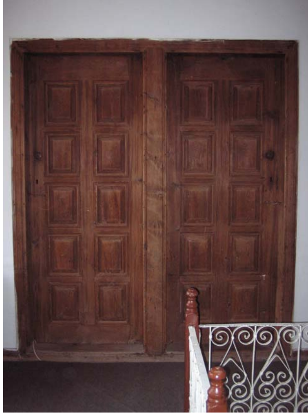
Şekil C.88. 108 Mekâni'ndan 106 ve 107 Mekânları'na açılan kapılar