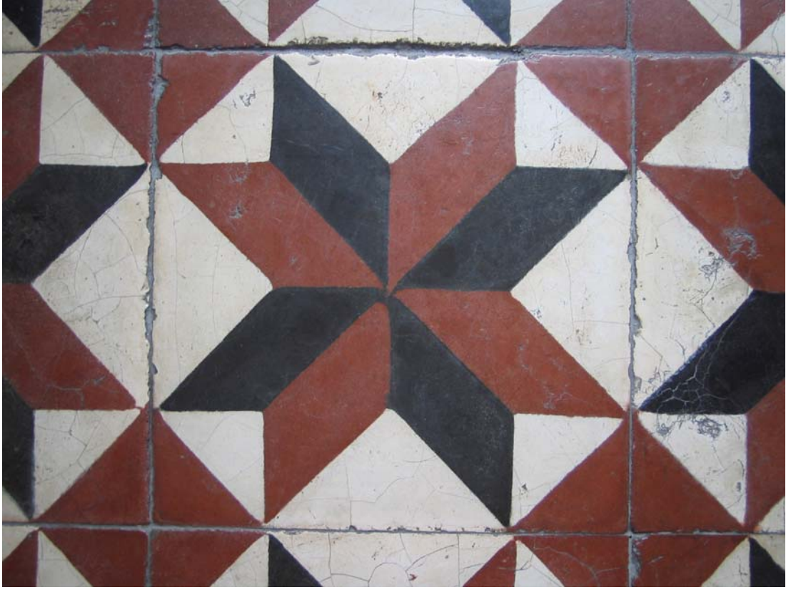
Şekil C.41. Z09 Mekânı terrazzo deseni