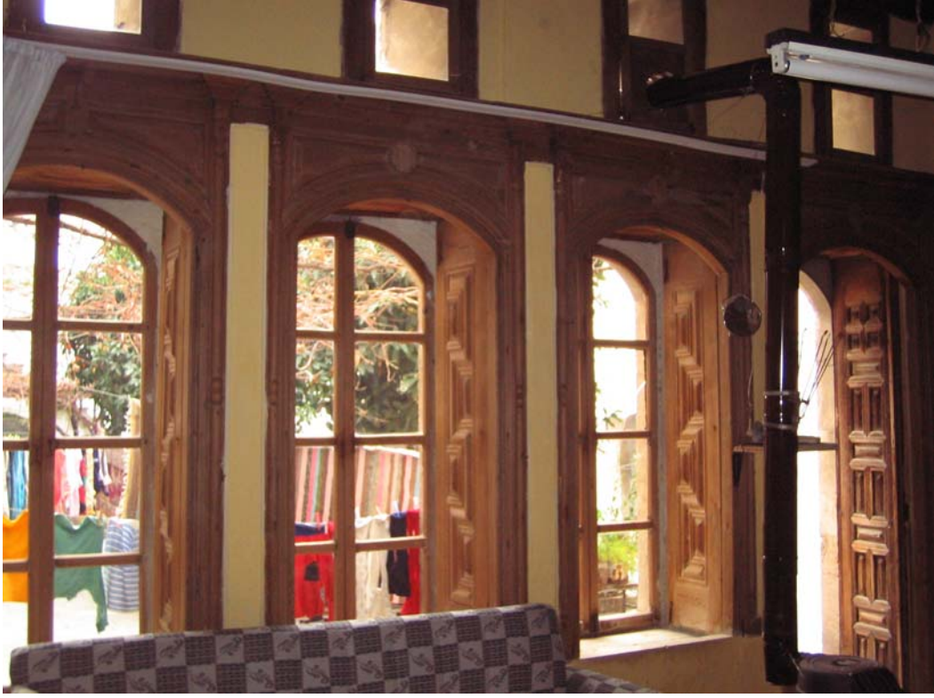
Şekil C.39. Z08 Mekânı avluya açılan pencereler