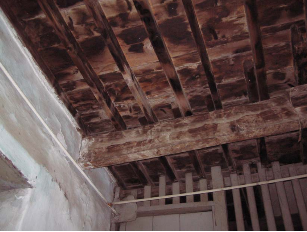
Şekil C.5. Giriş taşlığı tavanı