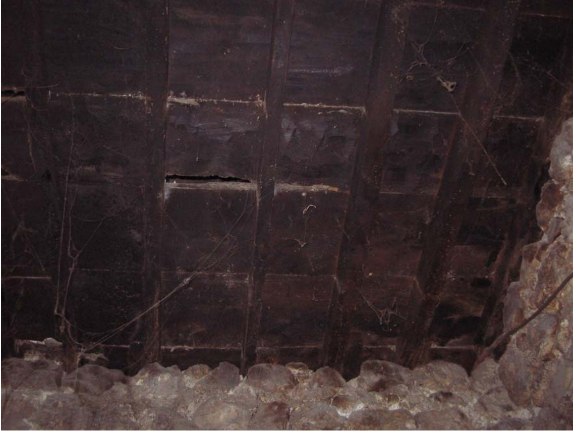
Şekil C.10. Z03 Mekânı tavanı