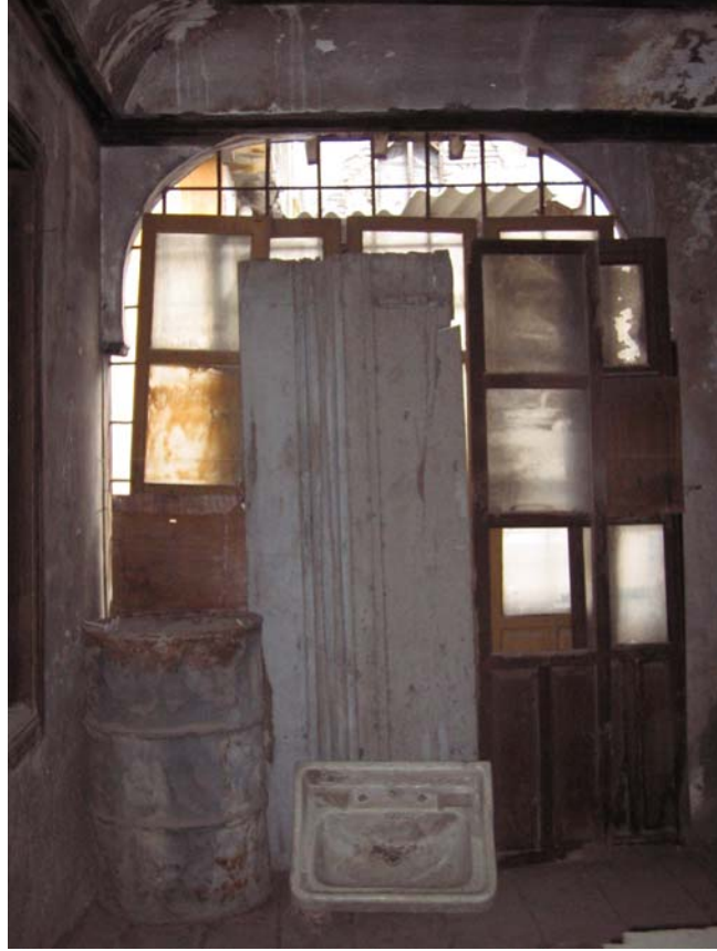
Şekil C.66. 101 Mekânı güneybatı duvarı