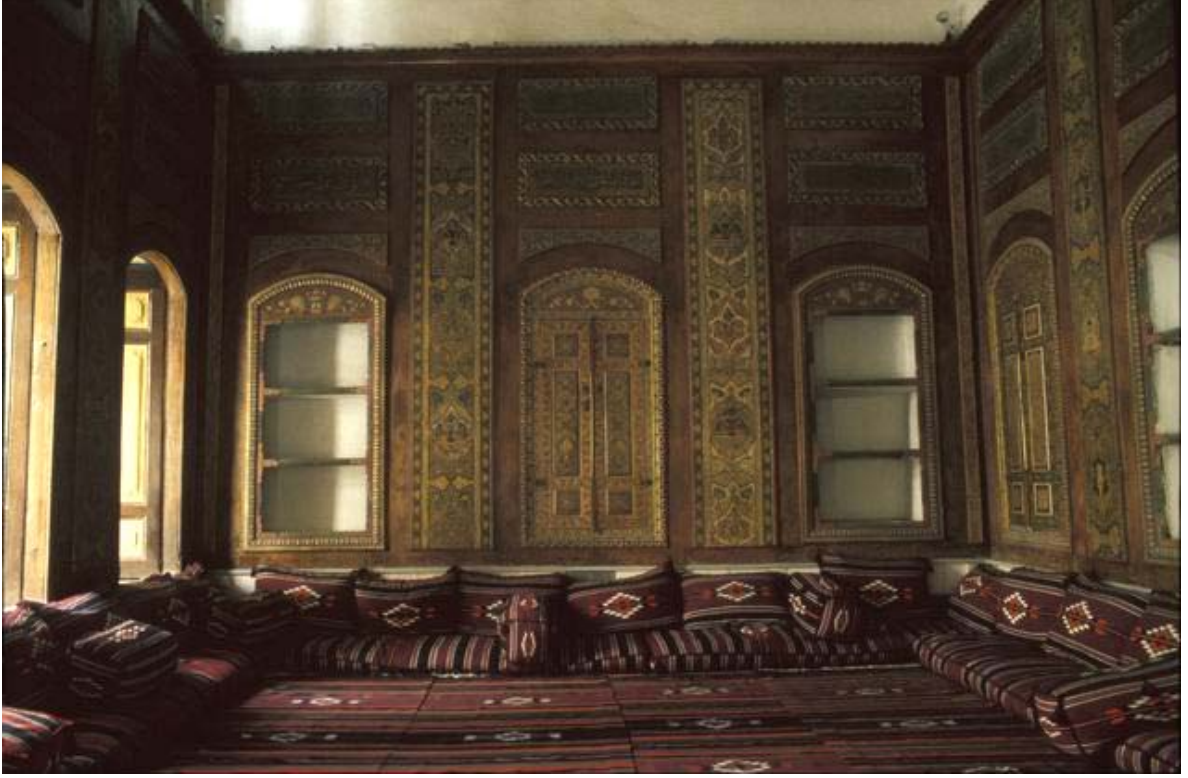
Şekil C.179. Eskiden kullanılan iç mekân tefrişleri (Weber, S., 2005)