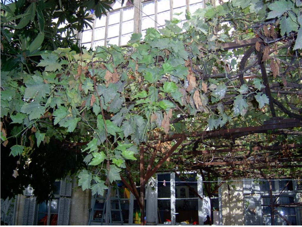
Şekil C.141. Avlu kuzeydoğu cephesi görünüşü