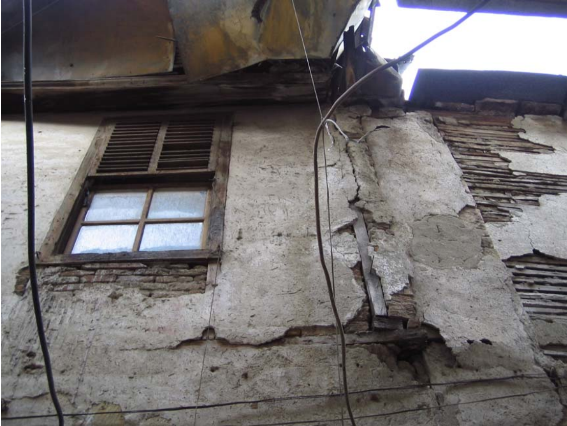
Şekil C.170. Kuzeybatı yönündeki komşu yapıda görülen sıva dökülmesi ve kepenk