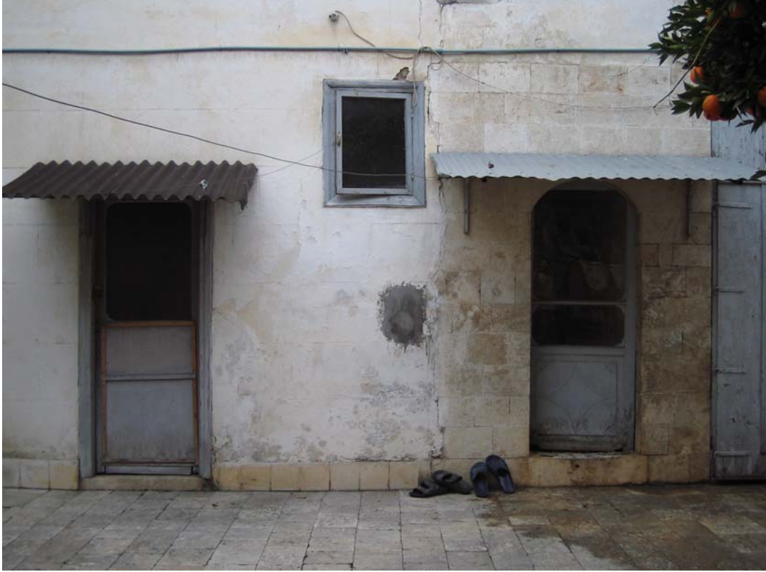
Şekil C.160. Avlu güneybatı cephesi KZ23 ve KZ27 kapıları görünüşü