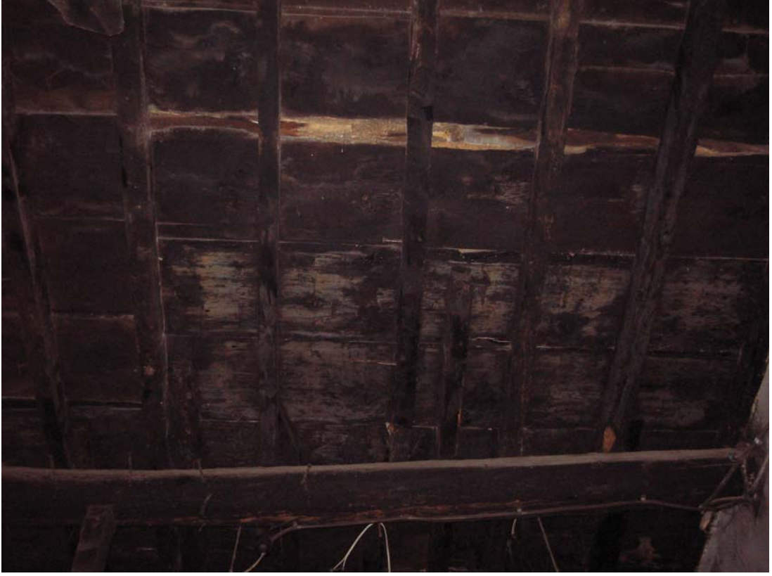
Şekil C.21. Z06 Mekânı tavanı