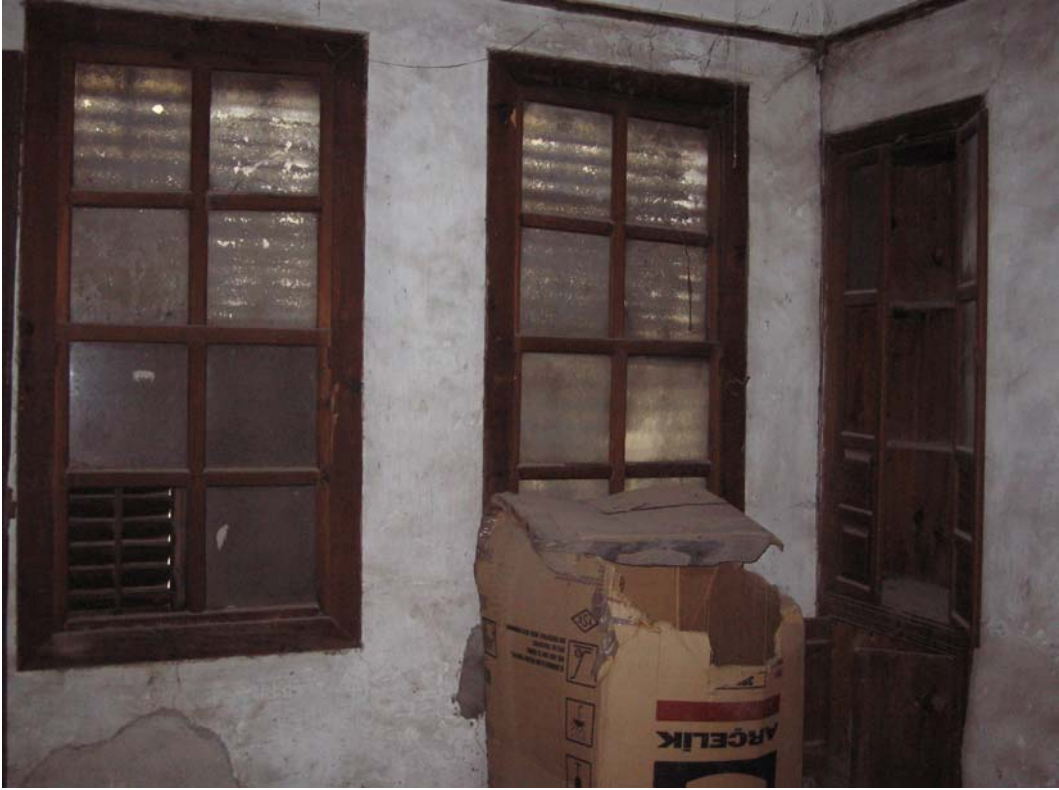
Şekil C.72. 103 Mekânı kuzeybatı duvarında yer alan dolap