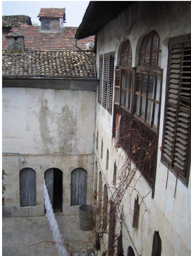
Şekil C.2. Yapının kuzeybatı ve güneybatı yönünde konumlanan, 19. yy.'da satın alınan özgün kütlelerinin kuzeydoğu yönünden görünüşü