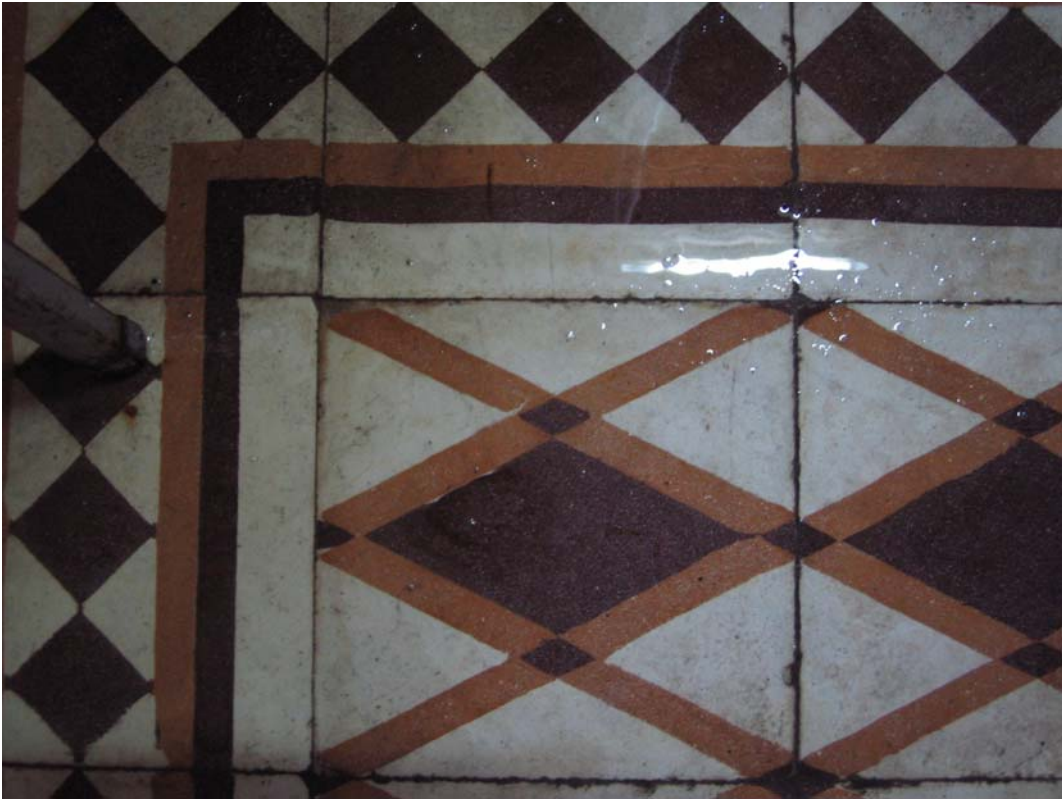
Şekil C.60. Z14 Mekâni terrazzo deseni