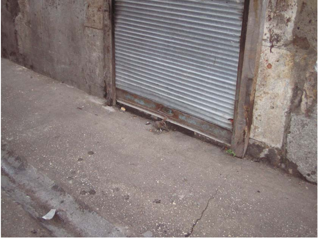
Şekil C.173. Kuzeybatı yönündeki komşu yapının zemin kat dükkânının eşiklik izi