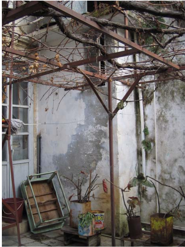
Şekil C.166. Avlu doğu köşesinde yer alan Z12-Helâ eki