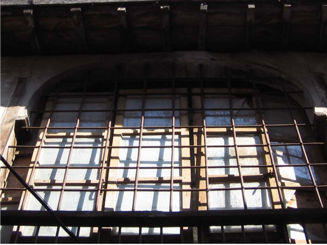
Şekil C.177. K101 kapısı Terziler Sokak'tan görünüşü