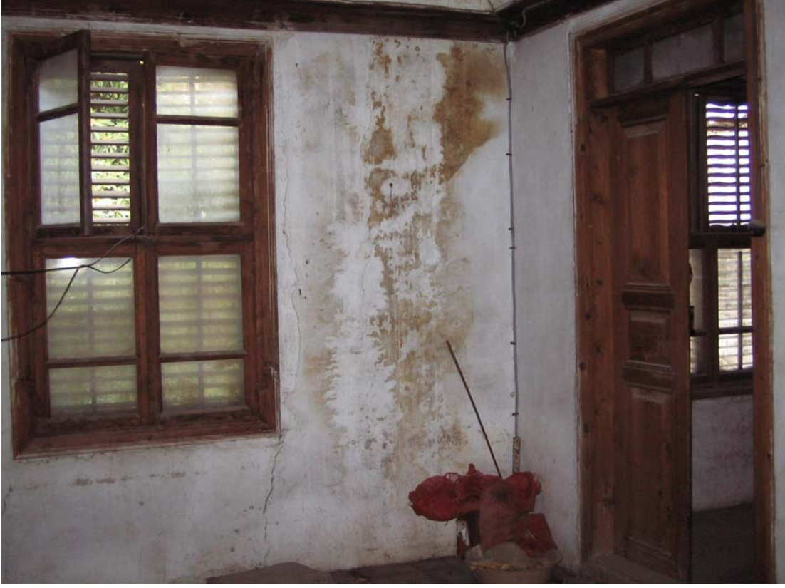
Şekil C.109. 119 Mekânı kuzeydoğu duvarı