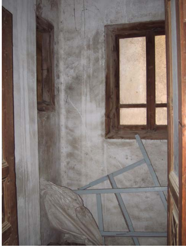
Şekil C.105. 117 Mekânı güneybatı yönünden görünüşü